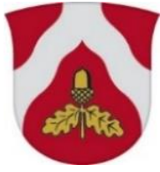
Lone Jakobi Borgmester Odder Kommune