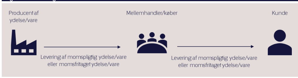
Figur 1. Momsregler ved mellemhandlere

I figur 2 (nedenfor) er der fortsat tale om et mellemhandler-forhold, men i modsætning til beskrivelsen i figur 1, er leveringen fra den oprindelige tjenesteyder/vareproducent til mellemhandleren omfattet af en momsfratagelse, der alene tillader momsfratagelse for den oprindelige tjenesteyder/vareproducent.