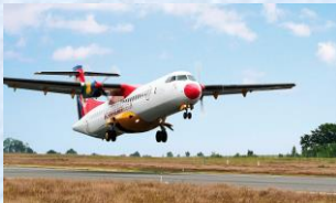
Turbo-prop fly med ca. 40 sæder (ATR 42 eller Dash 8-200)