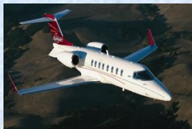
Små business jets 8-10 passagerer Learjet