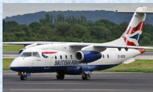
Mindre jetfly med ca. 32 passagerer, f.eks. Dornier 328 JET