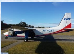
General Aviation, taxify, privatfly, andre småfly