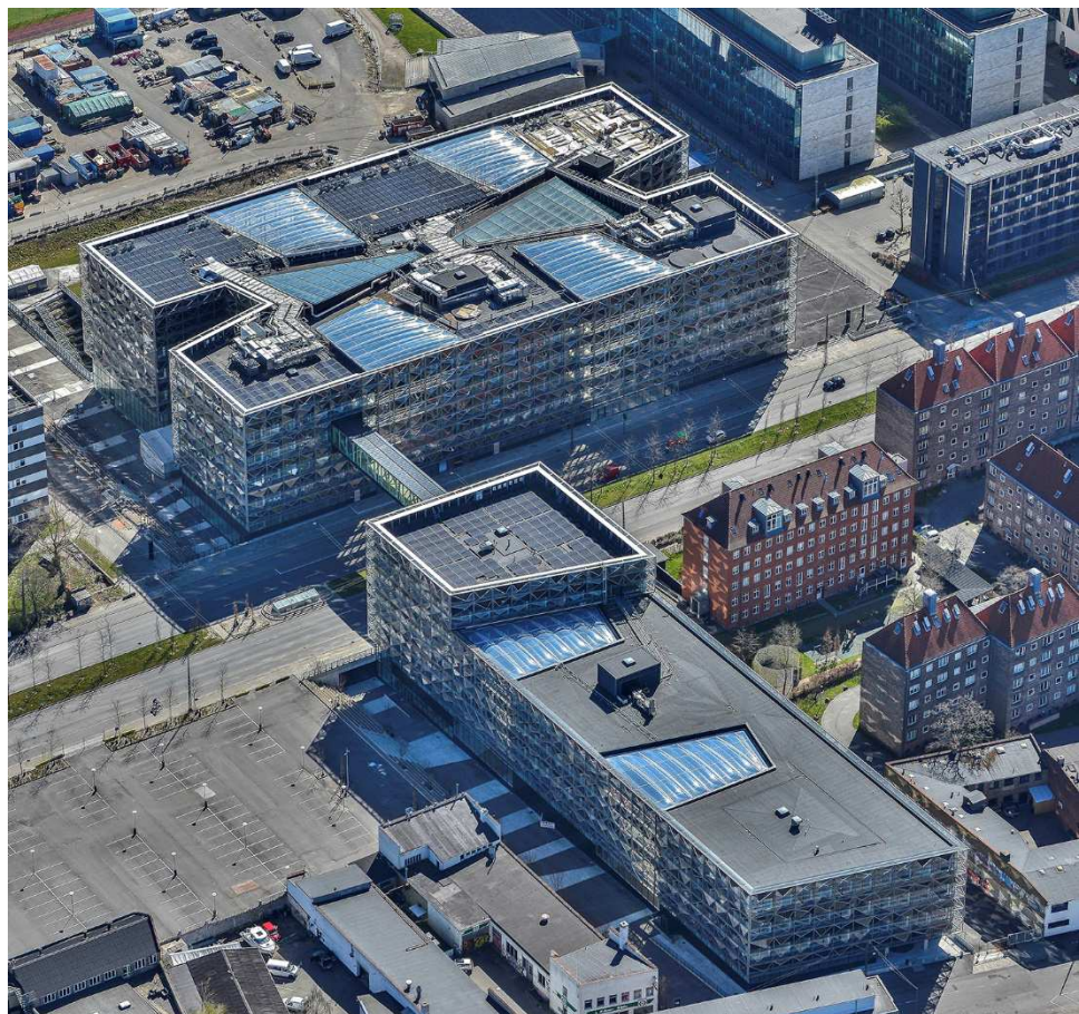
Luftfoto af Niels Bohr Bygningen, april 2020.

27. Vi har gennemgået udvalgte centrale ændringer i byggeriet af Niels Bohr Bygningen. Det drejer sig om de ændringer, som Bygningsstyrelsen og Københavns Universitet har indgået kontrakt om, men også ændringen af ventilationskanalerne fra stål til PVC og ændringen af stinkskafler fra stål til PVC. For hver af disse ændringer har vi undersøgt, om Bygningsstyrelsen forud for ændringen har skønnet og dokumenteret de forventede konsekvenser for økonomi, tid og funktionalitet. Med konsekvenser for funktionalitet mener vi ændringer i bygningens tekniske indretning såvel som afledte konsekvenser for bygningens kvalitet og funktionalitet.