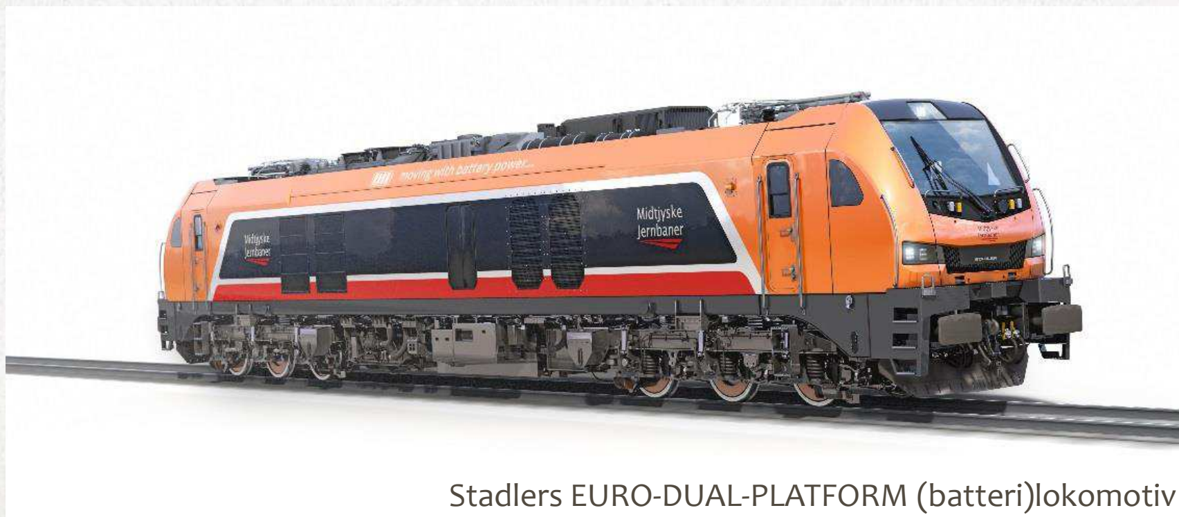
Stadlers EURO-DUAL-PLATFORM (batteri)lokomotiv