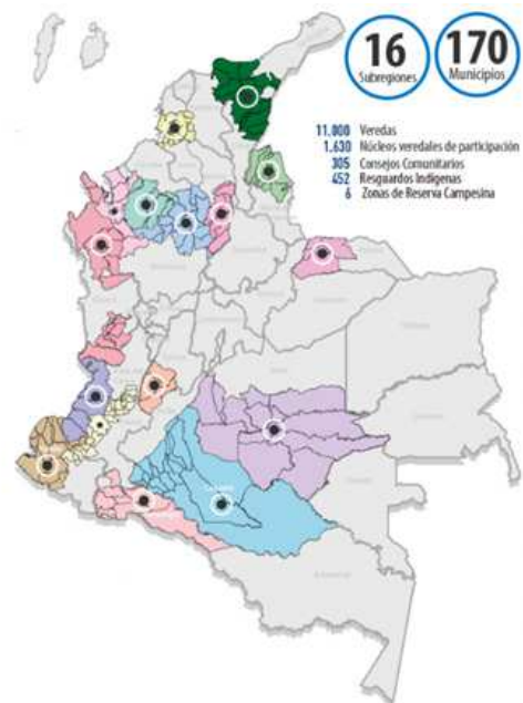
Figur 2: Kort over kommunerne, hvor PDET skal implementeres. Renovacionterritorio.gov.co, (2017), [online]. Tilgængelig på: http://www.renovacionterritorio.gov.co/especiales/especial_PDET/mapa.html

Kortet viser de kommuner, hvor PDET skal implementeres 28 .