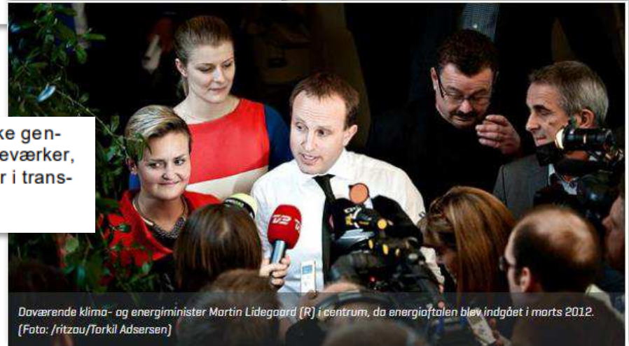
Daværende klima- og energiminister Martin Lidegaard (R) i centrum, da energiaftalen blev indgået i marts 2012.

Energiaftalen vil sikre fortsat omstilling til brug af bioenergi. Det skal bl.a. ske gennem initiativer til fremme af anvendelsen af biomasse på de store kraftvarmeværker, øge støtten til biogas og krav om fortsat øget anvendelse af biobrændstoffer i transportsektoren.