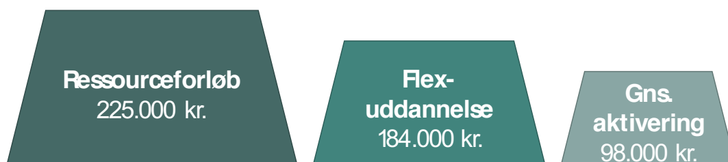
Figur 0.1 Årlige omkostninger til aktiv beskæftigelsesindsats og til Flexuddannelse

Note: Gns. omkostning til Flexuddannelsen pr. elev pr. år og gns. udgift til aktiv beskæftigelsesindsats (inkl. aktivering, andre beskæftigelsesordninger, administration af jobcentre, særlige indsatser mv.) pr. fuldtidsaktiveret pr. år. 2016-prisniveau, afrundet til 1.000 kr.