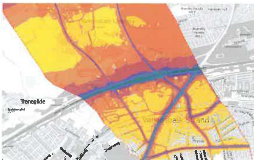
Støjkortlægning Vallensbæk syd, dag, 1,5 m over terræn

Illustrationerne viser, at der fortsat er behov for en massiv indsats for at mindske støjen fra motorvejene, ikke mindst fra Holbækmotorvejen, som ministeren ikke nævner i sit svar. Den ovenstående illustration af støjkortlægningen tager ikke højde for den kommende Ringstedbane, der i nord vil påvirke støjbilledet yderligere. Vi kan oplyse, at Vallensbæk Kommune har flere projekter i gang for at mindske støjen fra kommunens egne veje.