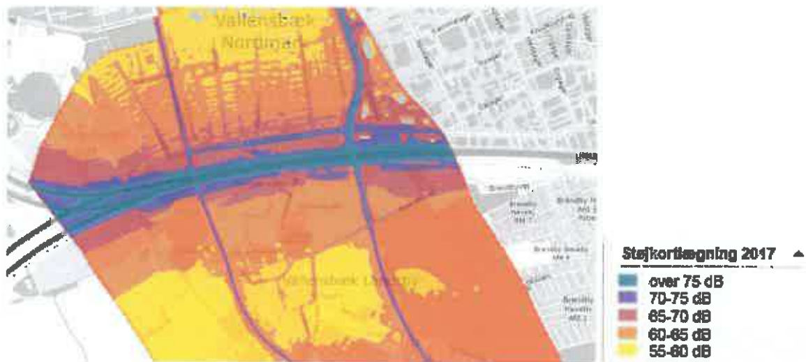
Støjkortlægning Vallensbæk midt og nord, dag, 1,5 m over terræn

De nyeste støjmålinger fra 2017 taler for sig selv: