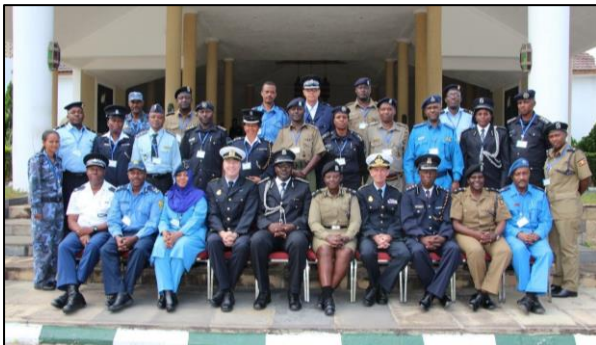
Som en del af støtten til EASF blev der i perioden 14. juni til 1. juli 2017 afholdt et dansk sponsoreret politimellemlederkursus i Kenya med 20 deltagere, heraf seks kvinder, fra ni af EASF's medlemslandene.