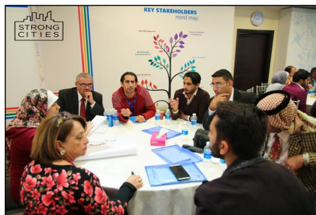
Aktiviteter under CVE Mellemøsten programmets Strong Cities Network indsats med lokale forebyggelsesnetværk i Jordan og Libanon.

Endelig bidrager indsatsen gennem støtte til 'strategisk modkommunikation' til at imødegå ISIL's budskaber og ideologi online. Der er tale om kommunikationsmateriale lavet af lokale moderate stemmer, der hjælper til at fremme forsoning i Irak gennem dialog og positive og realistiske fortællinger.