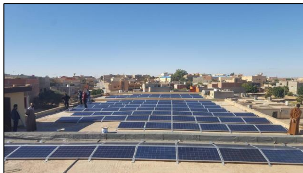
15 hospitaler i Libyen har fået installeret solpaneler for at sikre forsyningen under de mange strømafbrydelser. Genopbygning på sundhedsområdet er central for stabiliseringen af Libyen.

kendte libyske samlingsregering i at opbygge legitimitet blandt den libyske befolkning. Danmark støttede i 2017 med 10 mio. kr. fra Freds- og Stabiliseringsfonden den såkaldte Stabiliseringsfacilitet, som ledes af den libyske samlingsregering med støtte fra FN og det internationale samfund. De tre overordnede fokusområder for Faciliteten er 1) genopbygning af kritisk infrastruktur, 2) opbygning af lokale myndigheds kapacitet til at adressere befolkningens basale behov samt 3) styrke konfliktløsnings- og medieringskapaciteter på lokalt plan. Alle stabiliseringsaktiviteter støtter den politiske proces, som kan lede til mere inklusive og legitime regeringsstrukturer i Libyen for derved at lægge grundstenene til vedvarende forsoning samt bæredygtig genopbygning og udvikling. Konkrete aktiviteter omfatter bl.a. genopbygning af central infrastruktur herunder politistationer, regeringsbygninger, klinikker, vandfaciliteter, el-net og adgangsveje, facilitering af dialog mellem de lokale myndigheder og samlingsregeringen samt støtte til organisationer til at arbejde med lokale aktører mhp. at gennemføre lokale konfliktanalyser, træning og monitorering af konflikt dynamikker.