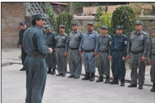
Gennem støtte til Law and Order Trust Fund betales lønninger til politiet, og Indenrigsministeriet reformeres.