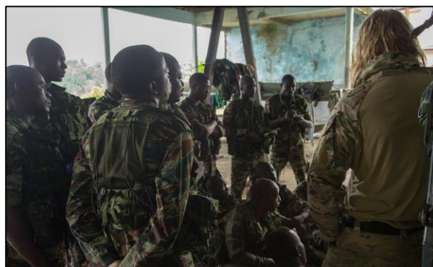
Frømandskorpsets kapacitetsopbygning af partnerenheder fra Cameroun i 2017.

Desuden har Frømandskorpset i 2017 gennemført kapacitetsopbygning af partnerenheder fra Nigeria og Cameroun med det formål at uddanne og øve disse enheder i praktiske færdigheder som sanitet, "boarding" af skibe samt bevissikring til søs.