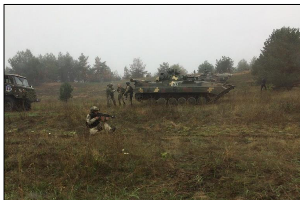
Ukrainske soldater gennemfører øvelse i rammen af træningsmissionen Operation Unifier, hvortil Danmark bidrager med sprogofficerer.

Indsatsen i Ukraine overgår fra 2018 til Freds- og Stabiliseringsfonden.