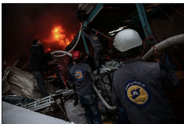
"De Hvide Hjelme" på brandslukningsopgave i Syrien

I tillæg hertil har Danmark i 2017 også støttet The International, Impartial and Independent Mechanism to Assist in the Investigation and Prosecution of Those Responsible for the Most Serious Crimes in Syria" (IIIM), som har til opgave at indsamle, behandle og vurdere bevismateriale med henblik på et kommende retsopgør i Syrien.