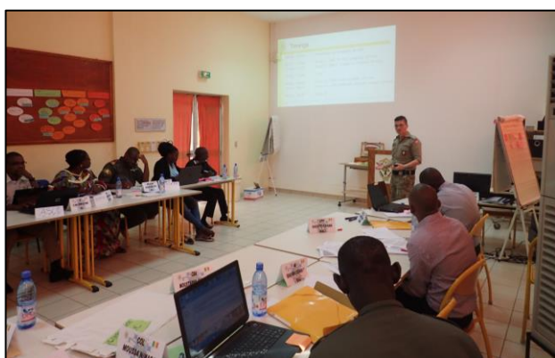
En instruktør fra Hjemmeværnet bidrog i 2017 til en evaluering af et kursus ved École de Maintien de la Paix i Bamako mhp., at kurset opnår FN certificering.

Under det regionale freds- og stabiliseringsprogram for Sahel, der løber frem til medio 2018, har Danmark i 2017 fortsat støttet til det regionale træningscenter École de Maintien de la Paix (EMP) i Bamako med bl.a. instruktørudsendelse fra Hjemmeværnet. Med midler fra Fondens reservepulje blev det desuden besluttet at støtte etableringen og opbygningen af G5 Sahelstyrken, som er en regional indsatsstyrke, der skal bidrage til stabilisering af Sahelregionen med styrker fra Mali, Niger, Burkina Faso, Tchad og Mauretanien. Danmark bidrager ligeledes til at styrke den demokratiske kontrol med styrkerne f.eks. med kurser til parlamentarikere. Det er besluttet at igangsætte en ny fase af programmet medio 2018.