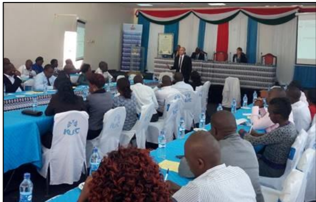
CBB underviser forskere og studerende ved Kenyatta University i Nairobi i forebyggelse af biologisk våbenudvikling, juni 2017.

den kenyanske regering, styrket den interministerielle koordination, etableret et biosikringsnetværk og igangsat initiativer til at styrke de operative bioberedskabskapaciteter.