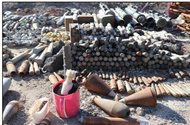
Eksplosiver fundet omkring Al-Shifa hospital i Mosul

2017 har øget behovet for minerydning, og Danmark har derfor også støttet minerydningsaktiviteter gennem særligt specialiserede organisationer i både Syrien og Irak (Tetrattech og Janus/Sterling).