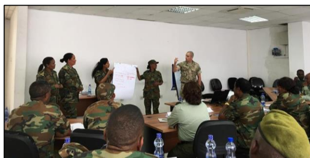
Billedet viser etiopiske styrker, der undervises i CIMIC af danske og britiske instruktører i efteråret 2017.

Det igangværende stabiliseringsprogram for Afrikas Horn fokuserer geografisk på Somalia, Kenya og Etiopien og løber frem til medio 2018, hvor en ny fase af programmet forventes igangsat. Et af programmets overordnede mål er at styrke den regionale fredsbevarende kapacitet, og som led heri har Danmark i 2017 støttet gennemførelsen af en større feltøvelse for den østafrikanske reaktionsstyrke (EASF). Endvidere har Danmark igen i 2017 bidraget til Somalia Stability Fund, der i 2017 styrkede sit strategiske fokus bl.a. ved en ny tilgang til at sikre inklusion af kvinder.