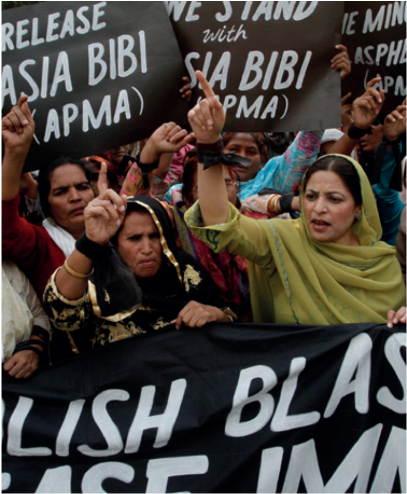
Den kristne pakistanske fembarnsmoren Asia Bibi ble i 2009 dømt til døden for påstått blasfemi. Det har vært internasjonale bestrebelsler for å få henne fri og Asia er blitt et symbol på kampen for religiøse minoriteters rettigheter.