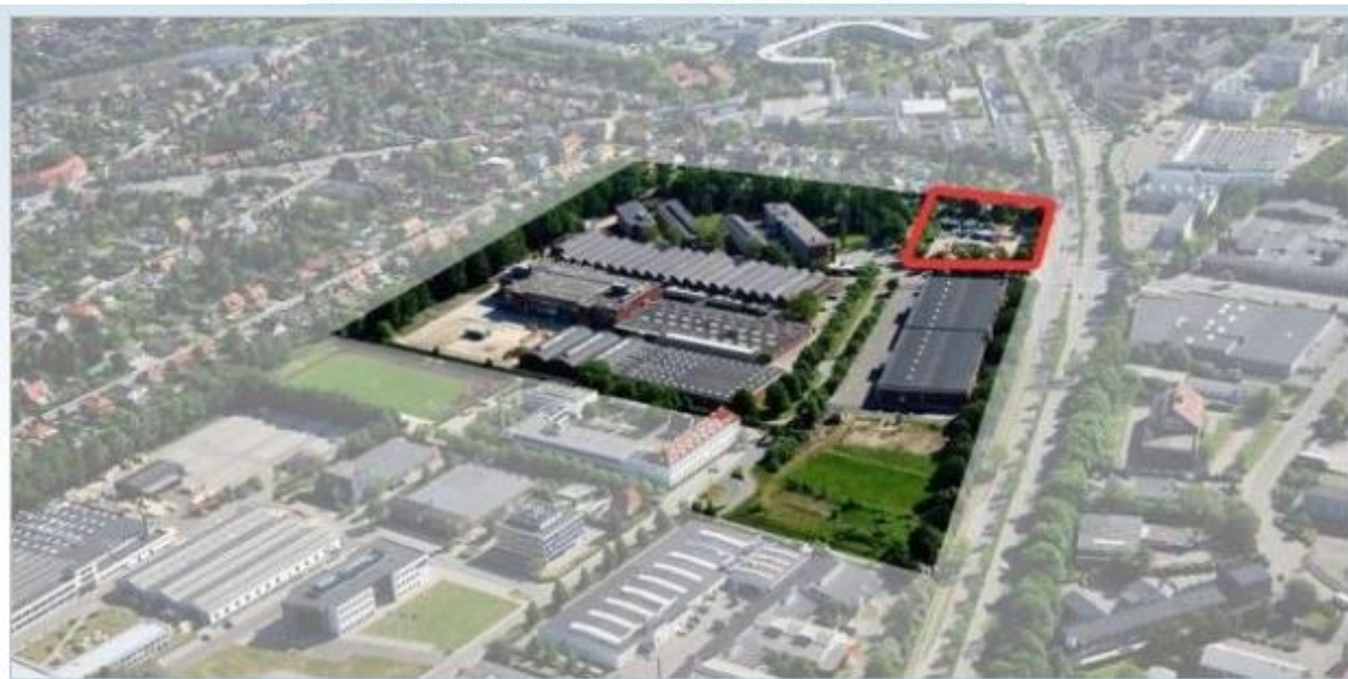
Luftfoto af tobaksgrunden, der snart bliver til et nyt byområde: NCC.