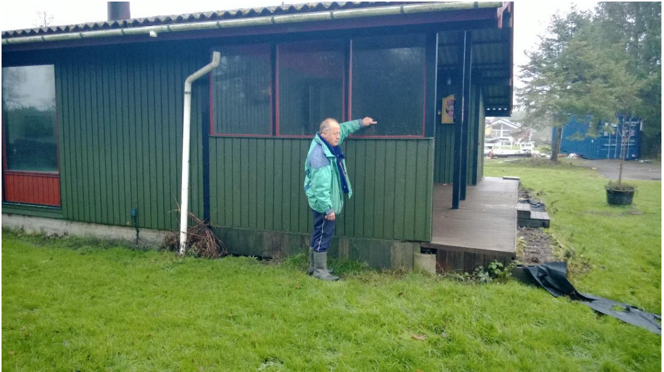
Hertil nåede vandet (markeret med finger).