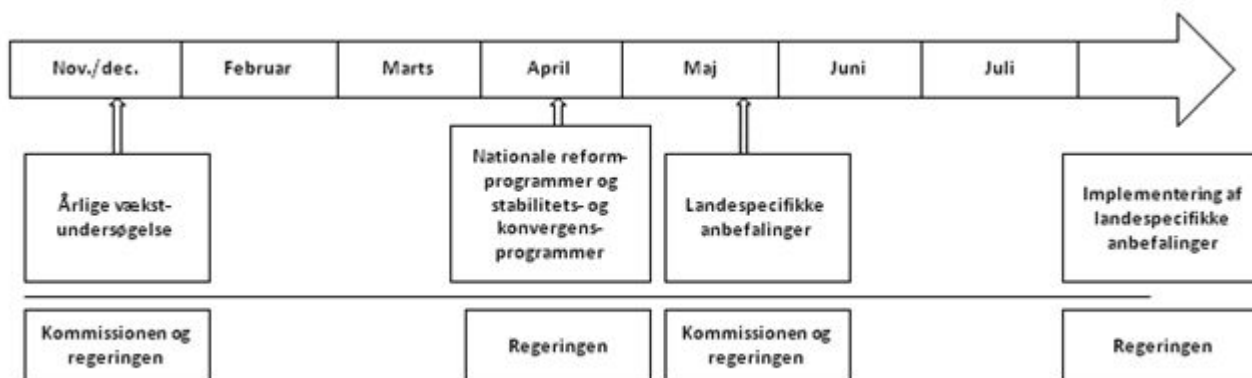
Figur 2: »Det nationale semester«

Derudover kan de to udvalg invitere de økonomiske vismænd og/eller repræsentanter for Nationalbanken m.fl. til at redegøre for deres økonomiske vurderinger.