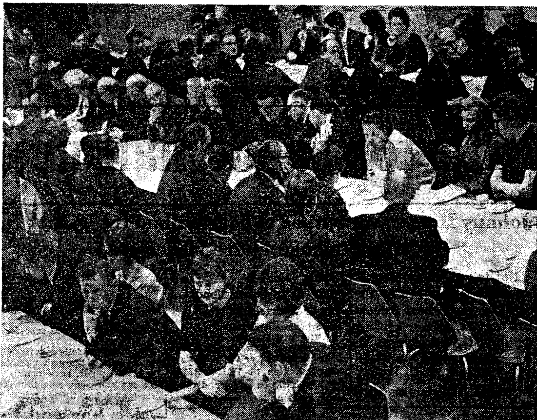
Et udsnit af den tætpakkede sal i Lindved sognegaard