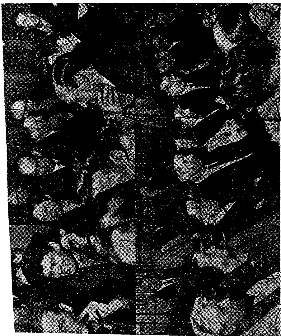
Et udsnit af deltagerne i den tætpakkede sal Torsdag den 29. februar 1968