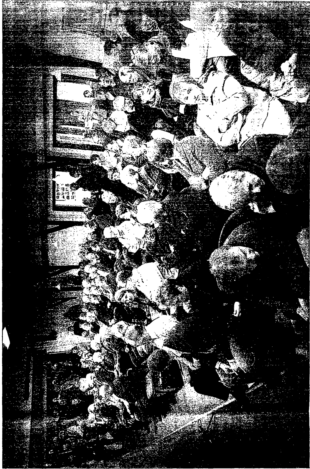
Der var stopfyldt i Grejs Borgergård i aftes, hvor den borgergruppe, der kæmper for at Grejs lægges sammen med Vejle Kommune i den kommende kommunalreform havde indkaldt til borgermøde. Og enten var det kun »vennerne«, der var dukket op, eller også så er der kun meget få Grejs-borgere, der ikke vil til Vejle.