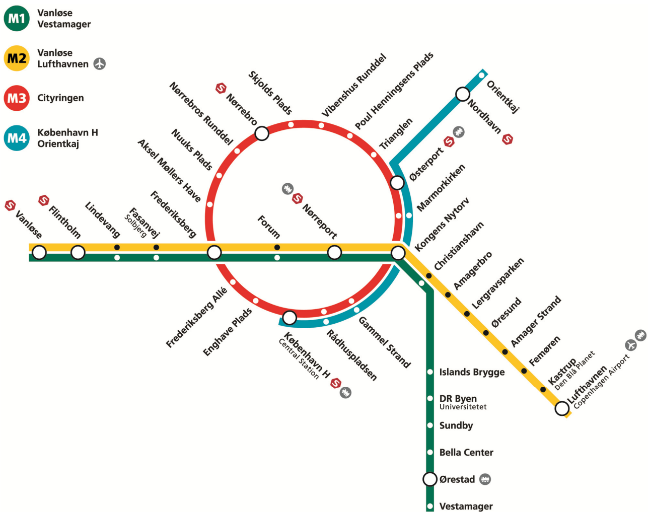
Figur 1. Cityringen

Figur 1 viser et kort over de eksisterende metrolinjer og Cityringen, som er den røde linje (M3) og den blå pendullinje (M4). Den blå linje viser også den kommende afgrening til Nordhavn fra M4. Som kortet viser, bliver Cityringen forbundet til den eksisterende Metro ved Frederiksberg Station og Kongens Nytorv Station. Derudover kommer der flere forbindelser mellem Metro og S-togslinjer samt fjern- og regionaltog.