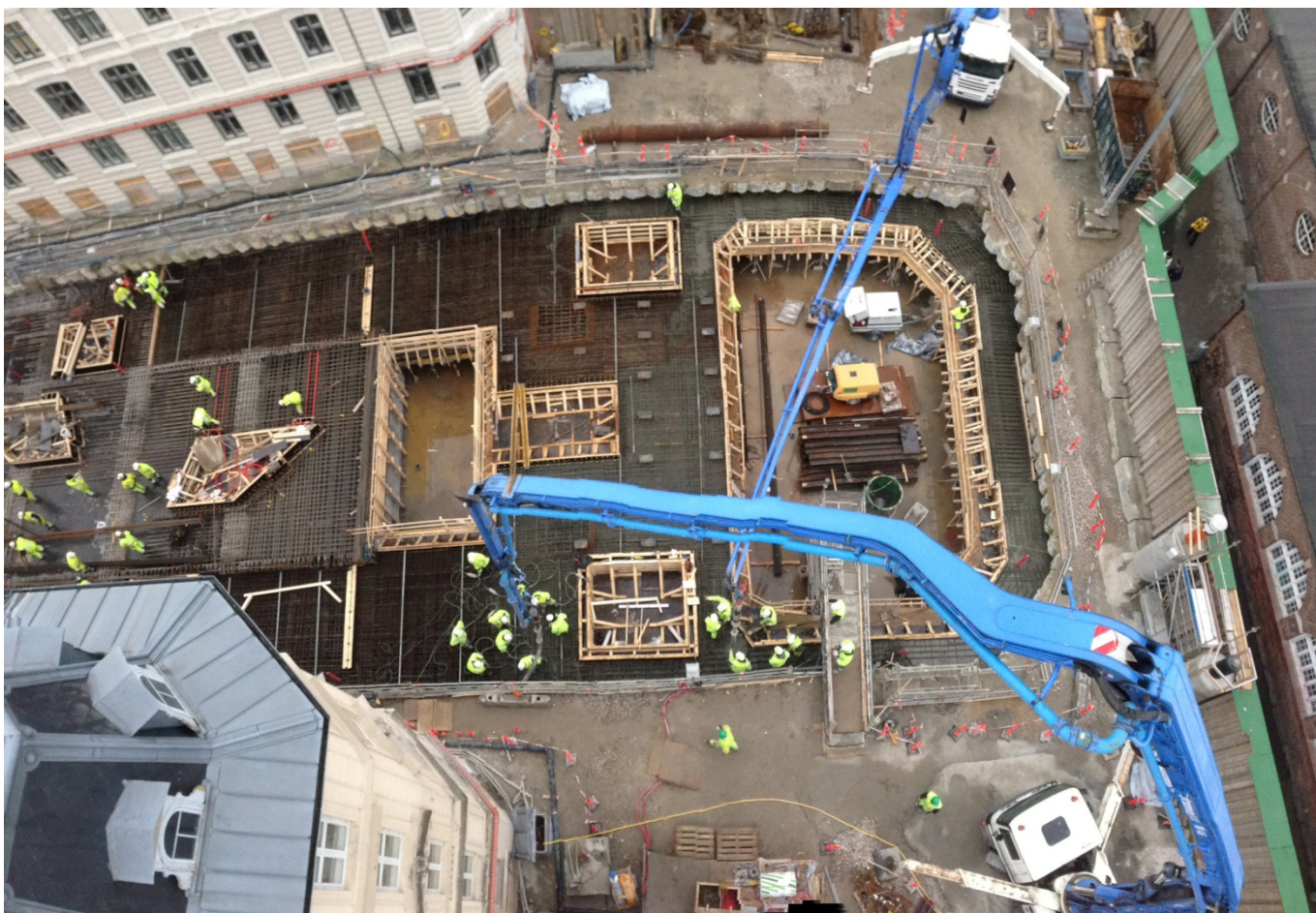
Stationsbyggeri ved Københavns Hovedbanegård.

Strakspåbud er defineret i miljøbeskyttelseslovens § 78. Et strakspåbud er et påbud (her en tilladelse) udstedt af en myndighed, som skal følges med det samme. I cityringsprojektet bruges strakspåbud til at regulere afvigelser fra de normale støjkrav.