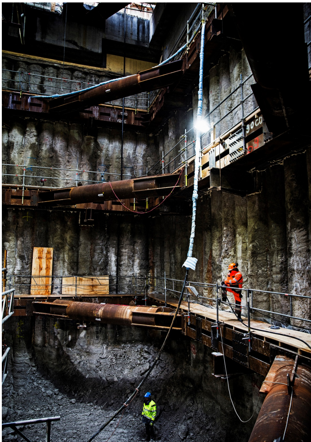
Stationsbyggeri ved Aksele Møllers Have.

33. CMT gik i gang med byggeriet på stationerne, efterhånden som de blev overdraget fra Metroselskabet. Det fremgår af Metroselskabets projektrapportering, at der i denne del af byggeriet i 2011 påløb forsinkelser på stationer på grund af langsom opstart af byggeriet fra CMT. En særlig udfordring for CMT var gennemførelsen af det detaljerede design af byggeriet. Det betød, at byggeriet på de enkelte stationer ikke kunne gå i gang efter tidsplanen.