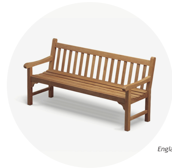
England Bænk 180, Teak

12 havebænke til Den Reserverede Have ved Fredensborg Slot.