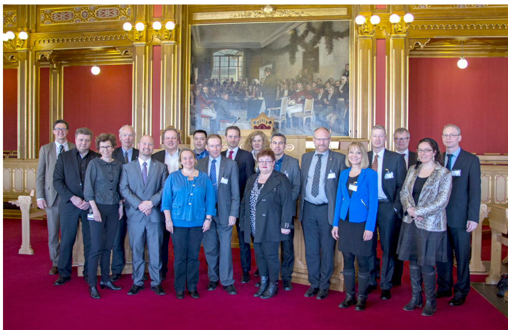
Deltagere i Nordisk netværksmøde for parlamentariske revisionsorganer, Oslo 2013

Medlemmer af de nordiske parlameters revisionsorganer mødtes herefter i Stortinget i Oslo den 22. april 2013 til et nyt seminar, hvor man bl.a. drøftede udvalgte oplysninger i den nye database.