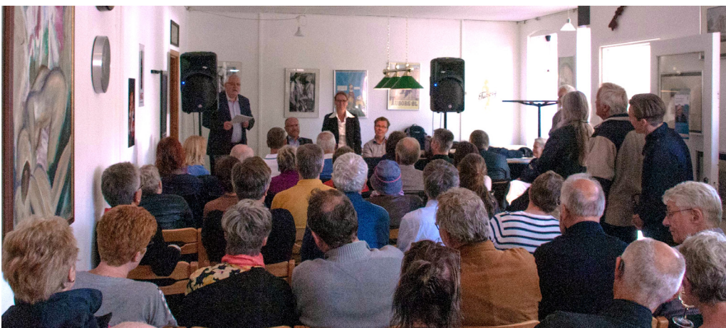
Et velbesøgt Folkemøde