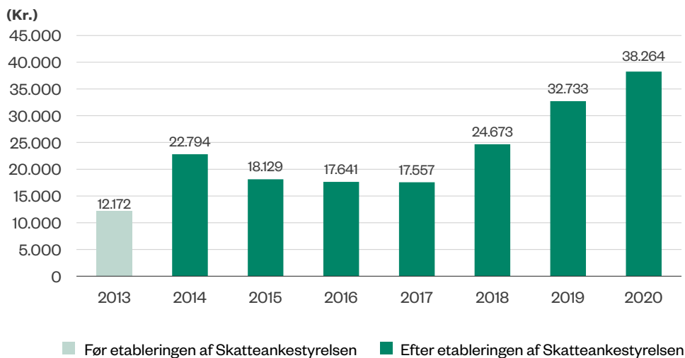
Figur 1 Omkostninger pr. klagesag i perioden 2014-2020

Note: Tallene før og efter etableringen af Skatteankestyrelsen er ikke fuldt ud sammenlignelige på grund af ændrede klageregler. Beretningen omhandlede perioden frem til 30. juni 2016, hvorfor der ikke forelå tal for hele 2016, da beretningen blev afgivet. Da tallene i figuren omhandler hele 2016, afviger tallet fra det oplyste i beretningen. Beregningen af de gennemsnitlige omkostninger pr. klagesag er opgjort på baggrund af de samlede årlige udgifter (ordinære driftsomkostninger) i forhold til antal afgjorte klager (sagsafgang). Produktiviteten beregnes på årsbasis og er derfor ikke tilgængelig for 2021.