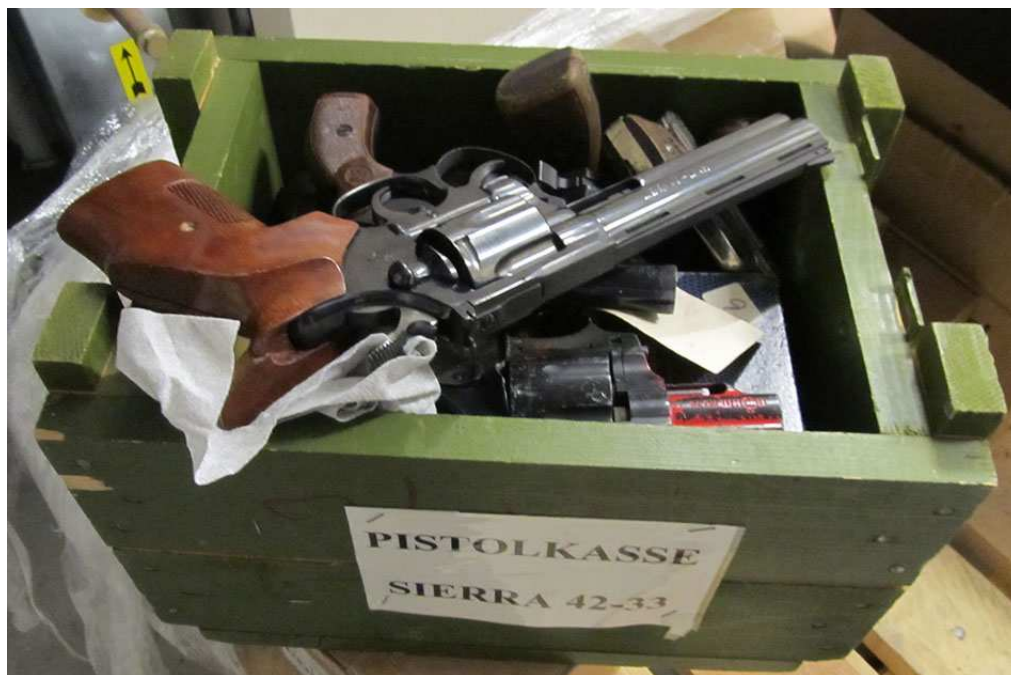
Kasse med løse våben i en politikreds.