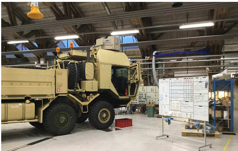
Værksted under Forsvarets Hovedværksteder.

Rigsrevisionen kan konstatere, at VFK ikke har sikret et grundlag, der gør det muligt at følge op på, om der opnås effektiviseringer med initiativet Materielvedligehold. VFK er derfor ikke i stand til at vurdere, om reducerede omkostninger til materielvedligehold hos de enkelte berørte myndigheder skyldes egentlige effektiviseringer eller blot besparelser som følge af fx en reduceret vedligeholdelsesproduktion eller flytning og/eller udskydelse af vedligeholdelsesopgaver til senere år.