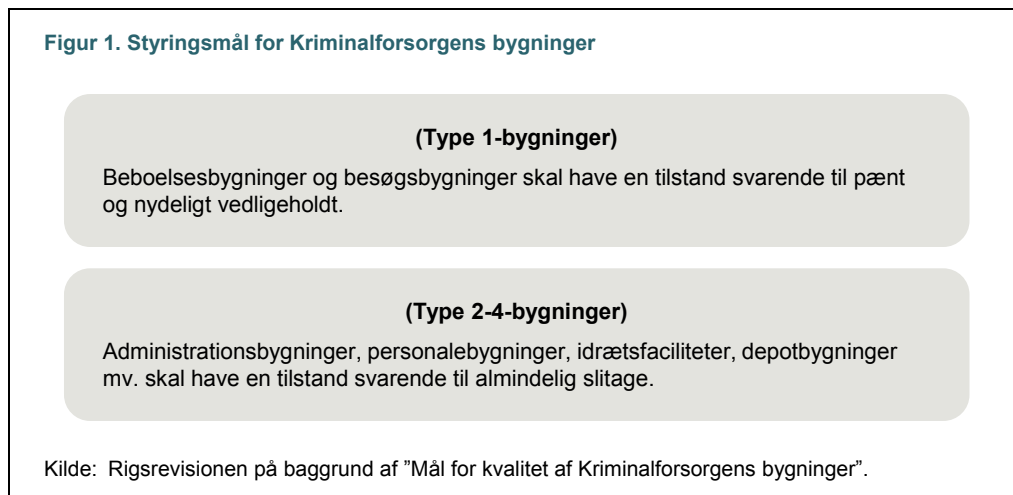
Figur 1. Styringsmål for Kriminalforsorgens bygninger

Styringsmålene for kvaliteten af Kriminalforsorgens bygninger skal anvendes både i prioriteringen af bygge- og vedligeholdelsespuljen og ved opgørelsen af det samlede vedligeholdelsesbehov.