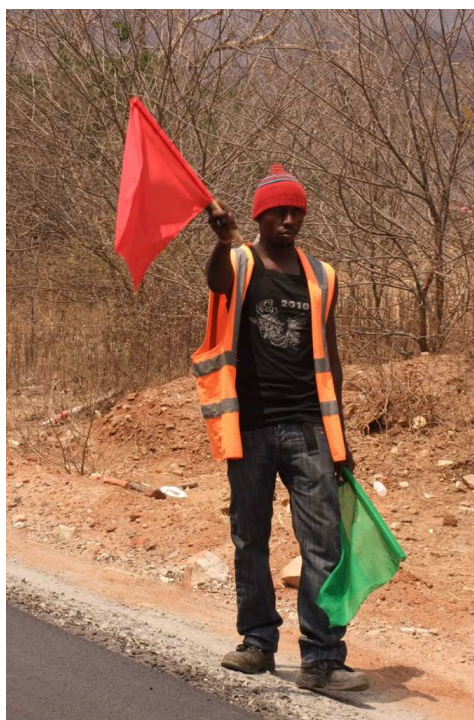
Vejarbejder i Tanzania

Statsrevisorerne fik generelt et positivt indtryk af de besigtigede aktiviteter i Tanzania og Uganda. Dette indtryk indebærer naturligvis ikke, at egentlige evalueringer af effekten af sektorprogrammerne eller af enkelte projekter ikke senere vil kunne vise, at bistanden kunne være ydet anderledes eller bedre. Statsreviso-