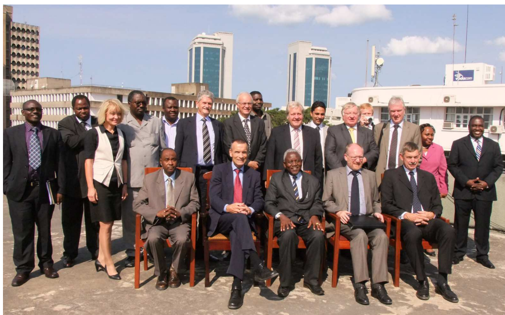
Gruppenbillede med Rigsrevisionen i Tanzania

Danmark yder generel budgetstøtte til lande, hvis politiske og administrative systemer er parate, hvilket også giver mulighed for at trække sig ud af sektorprogrammer. Ydelse af generel budgetstøtte kan medvirke til kapacitetsopbygning, fokusere på prioriteringer i statsbudgettet og styrke mulighederne for dialog med modtagerlandet - fx om bekæmpelse af korruption, indførelse og