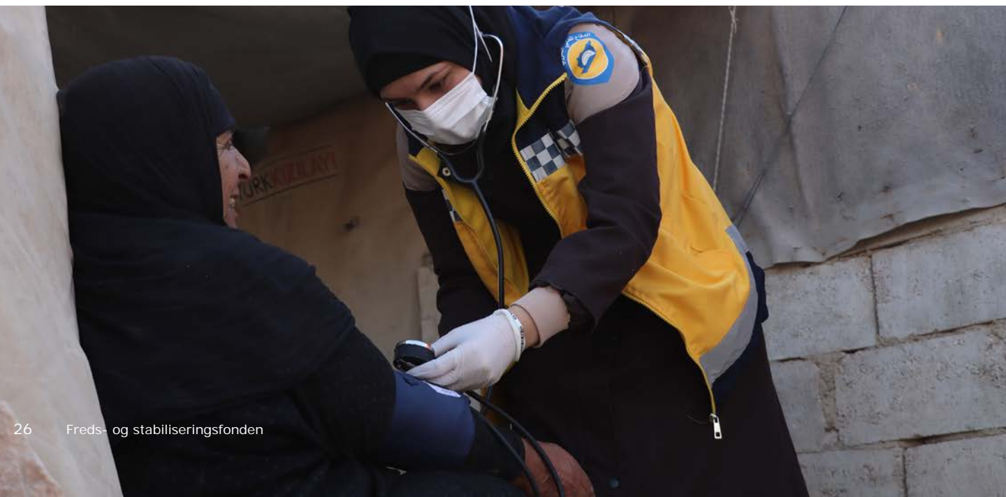
Foto: Hvide Hjelms frivillige: De Hvide Hjelms frivillige responderede til mere end 780 angreb på civile og civile områder i 2022.

Foto: Hvide Hjelms frivillige: De Hvide Hjelms kvindelige frivillige udførte hjemmebesøg i camps for fordrevne i det nordvestlige Syrien.