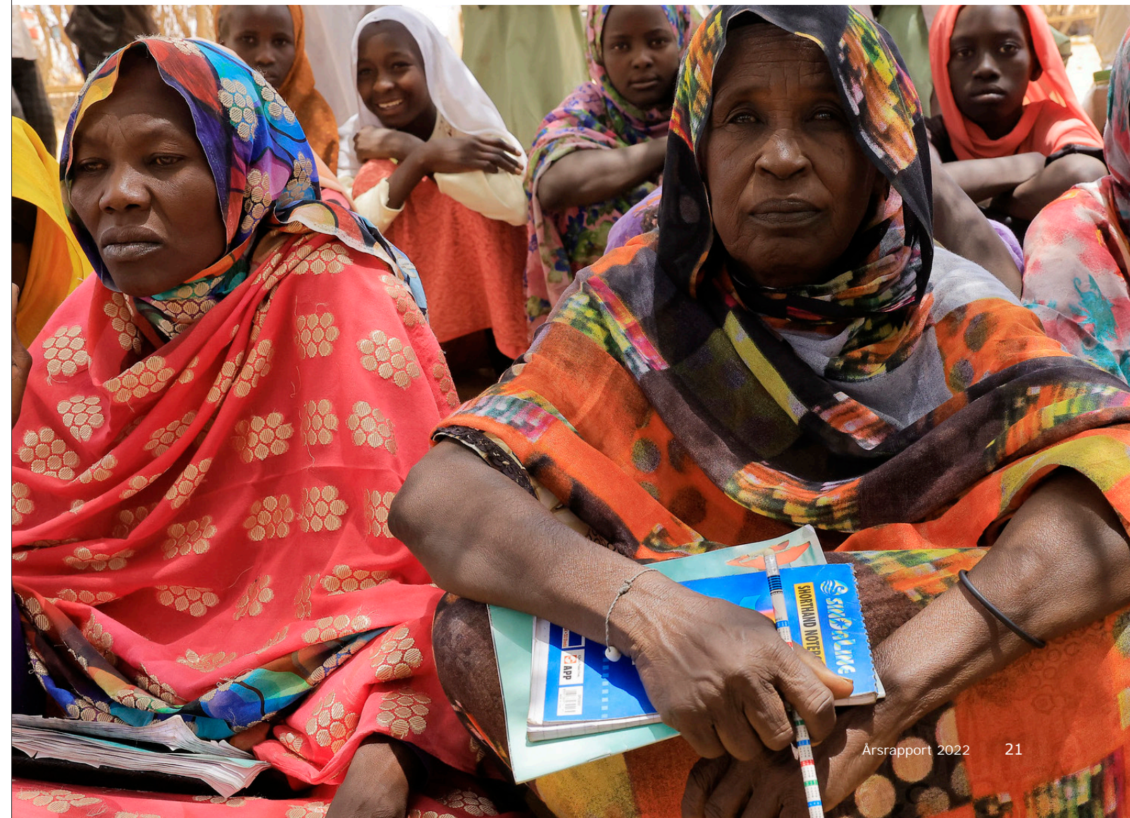
Foto: Fredsopbygningsfondens sekretariat i Sudan: Kvinde deltager i læsekurser på den lokale skole i Umm al Khairat i Øst Darfur.

Danmarks støtte medvirker til, at FN kan give hurtig, fleksibel og risikovillig støtte til konfliktforebyggelse og fredsopbygning.