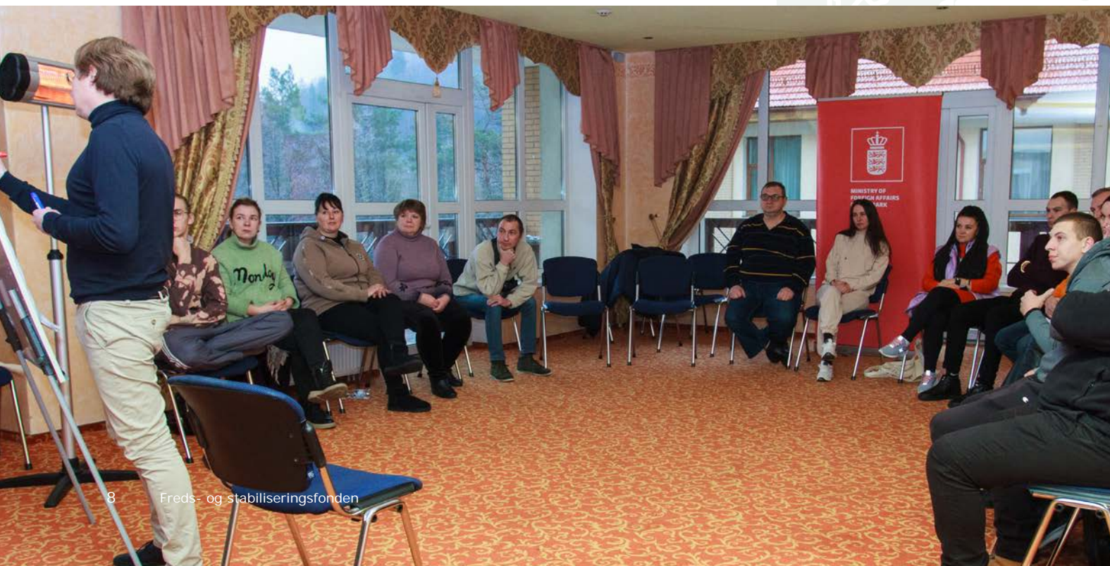
Foto: Vitalii Shevelev / UNDP i Ukraine: Genopbygningstræning for civilsamfundsaktivister og frivillige i Mykolaiv. 20.-21. december 2022.