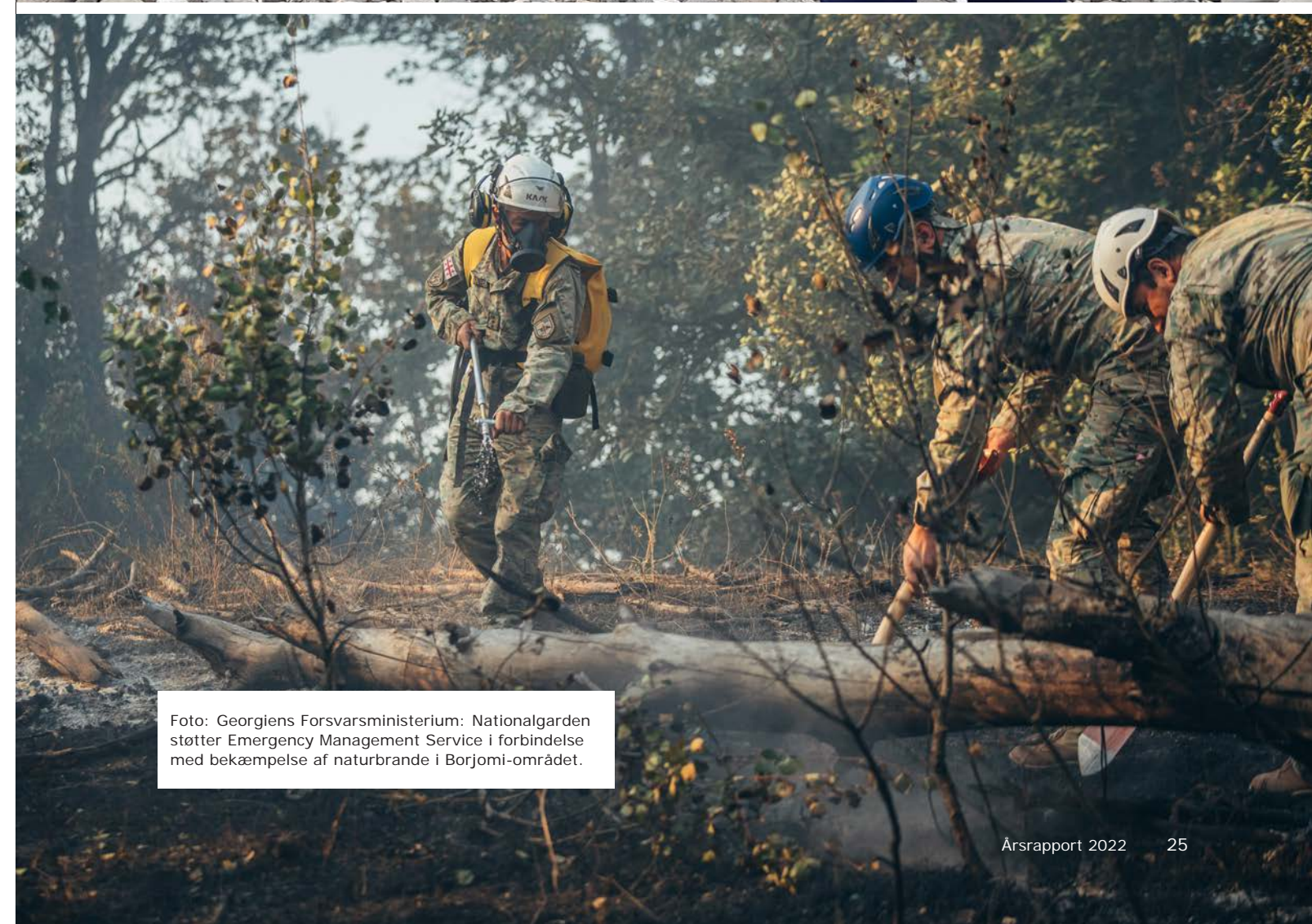
Foto: Georgiens Forsvarsministerium: Nationalgarden støtter Emergency Management Service i forbindelse med bekæmpelse af naturbrande i Borjomi-området.