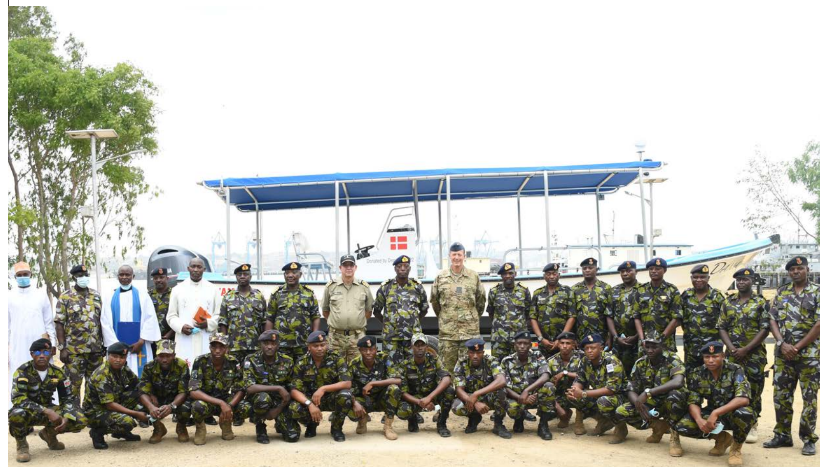
Foto: Kenya Navy Public Affairs: Overdragelse af den første dansk donerede dykkerbåd til Kenya Navy, 2022.

farvand samt indgå som del af Kenyas bidrag til ATMIS-missionen i Somalia. Videre fortsatte man bestræbelserne på at få Kenya optaget som medlem af den amerikanske koalition Combined Maritime Force til bekæmpelse af pirateri og kriminalitet til søs.