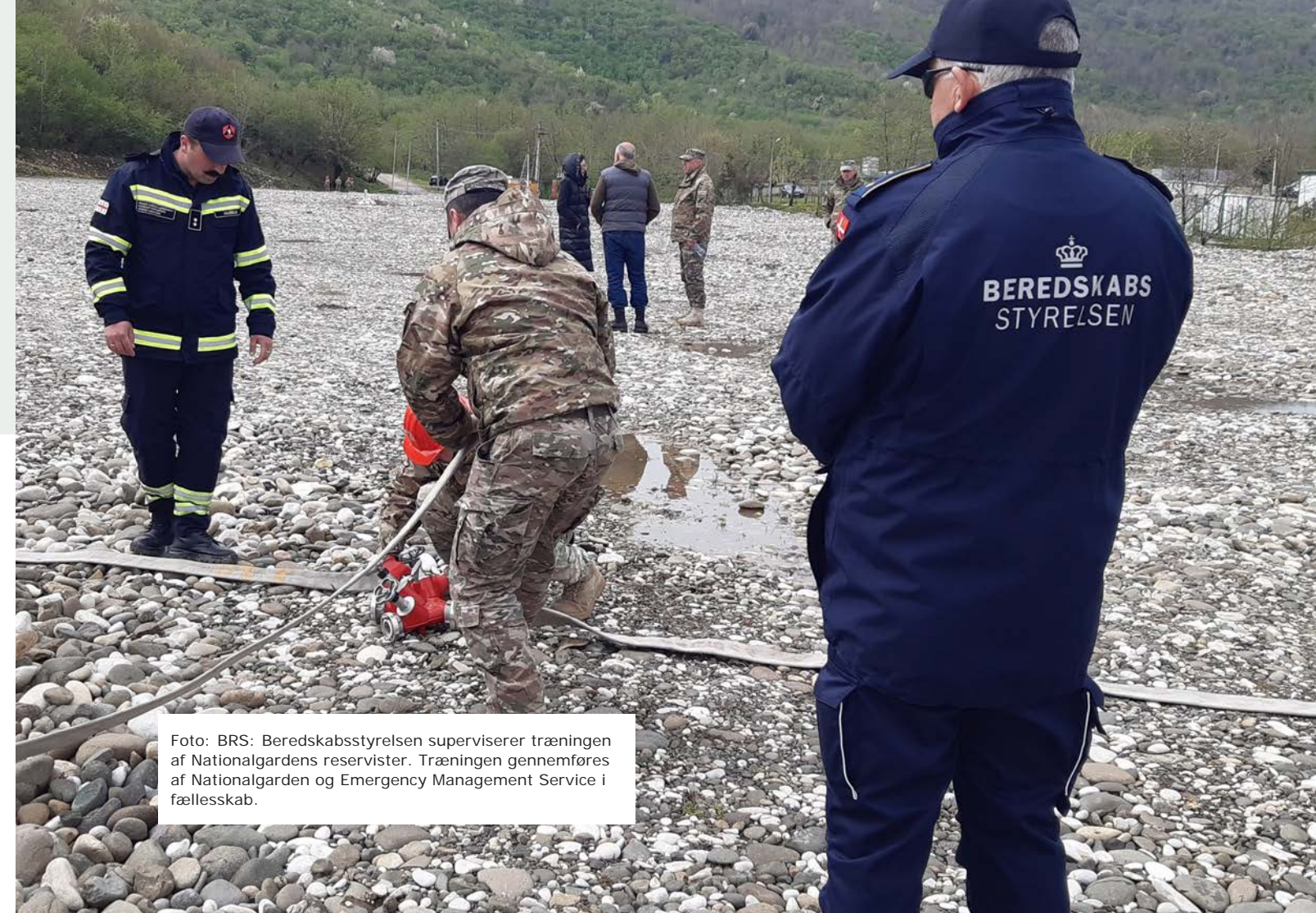
Foto: BRS: Beredskabsstyrelsen superviserer træningen af Nationalgardens reservister. Træningen gennemføres af Nationalgarden og Emergency Management Service i fællesskab.

Med den nye sikkerhedspolitiske situation, affødt af krigen i Ukraine, har Forsvarsministeriet fra 2023 besluttet at øge den danske støtte til Georgien på både det militære og civile område. I forberedelserne til dette er der således blevet afholdt både "fact-finding-" og forberedelsesmissioner med repræsentanter fra både Forsvarsministeriet, Forsvarskommandoen, Hjemmeværnet, Forsvarsakademiet og Beredskabsstyrelsen. Formålet med den øgede støtte er at styrke georgisk modstandsdygtighed, samt afskrækkelse og afvisning af potentiel russisk aggression.