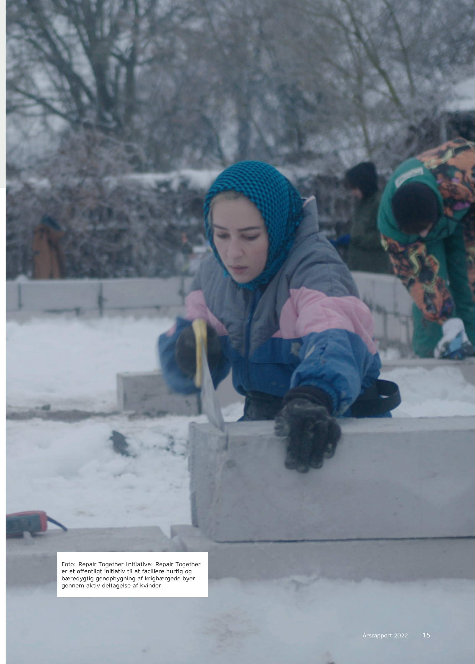
Foto: Repair Together Initiative: Repair Together er et offentligt initiativ til at facilitere hurtig og bæredygtig genopbygning af krigshærgede byer gennem aktiv deltagelse af kvinder.

Endvidere har Forsvaret gennemført træning, bidraget med rådgivning og koordinering af støtten til Ukraine samt støttet Ukraines kapacitetsopbygning gennem NATO Comprehensive Assistance Package.