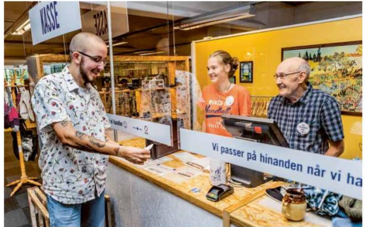
150 frivillige arbejder i Blå Kors Genbrugscenter i Horsens og bidrager dermed til organisationens sociale arbejde.

Tænk os ind i løsninger på tværs af politikområder og politiske skel