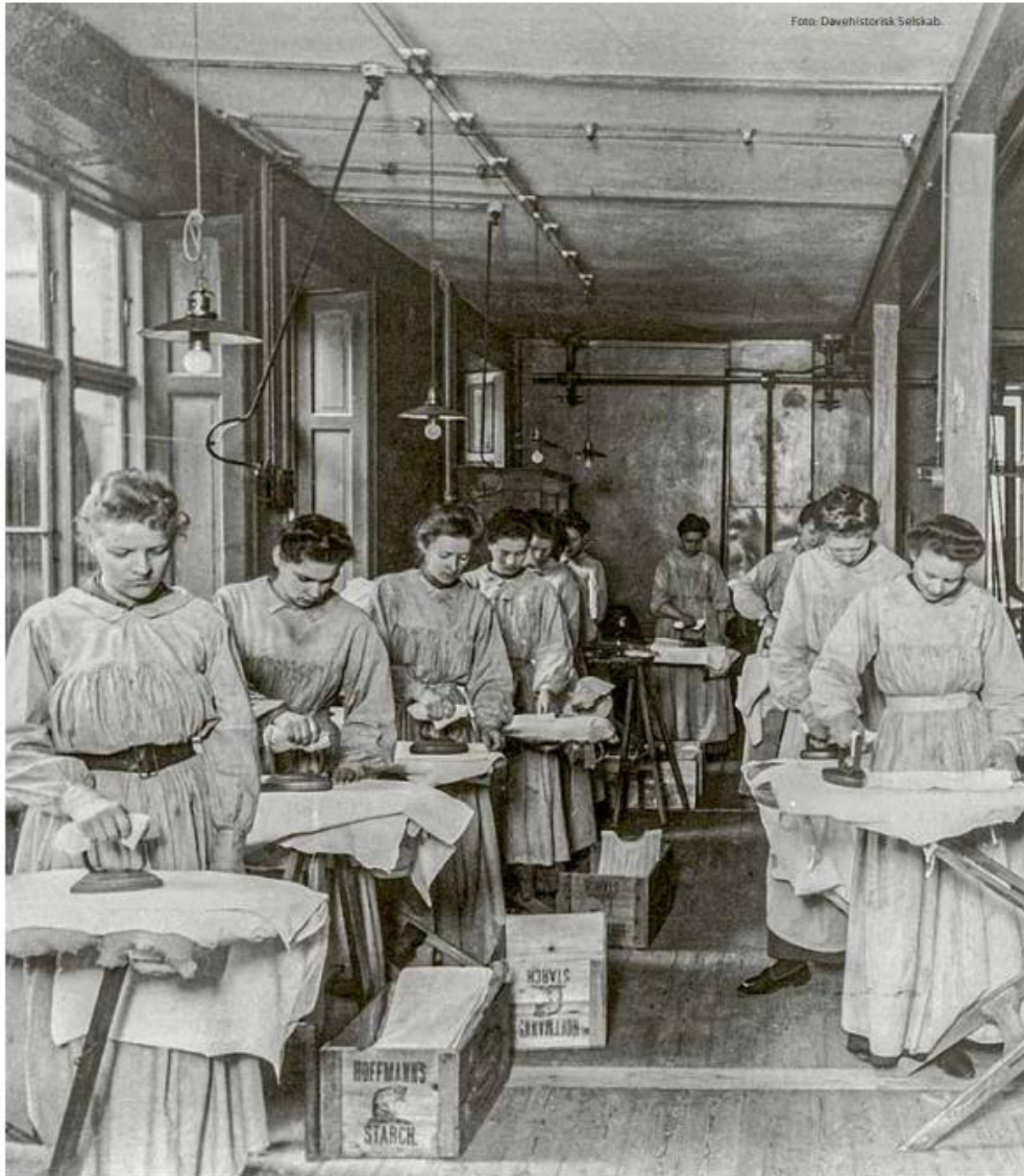
Unge døve kvinder lærer syning, vask og strykning på Arbejdshjemmet for Døvstumme Piger (som senere blev til CFD) 1910.