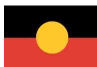
Australsk aboriginal flag