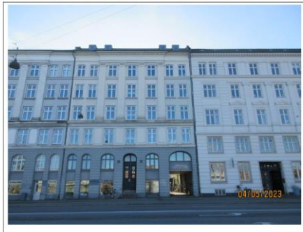
A/B Nørre Søgade 45