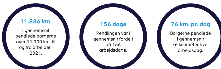
Figur 1. Borgernes gennemsnitlige pendling i 2021.

Anm.: Opgørelsen dækker over borgere med simple skatteforhold, der har oplyst om deres kørselsfradrag på TastSelv for indkomståret 2021.