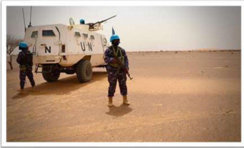
MINUSMA troops on patrol

UN Police in accordance with the standards of the UN Police Strategic Guidance Framework. Also, in 2022, DPO, in partnership with Member States, will deliver the new National Investigation Officer (NIO) training of trainer programmes. A minimum of four courses are planned during the year. The aim of the NIO courses is to build Member State capacity to train NIOs to UN standards. Effective NIO investigations are an essential element