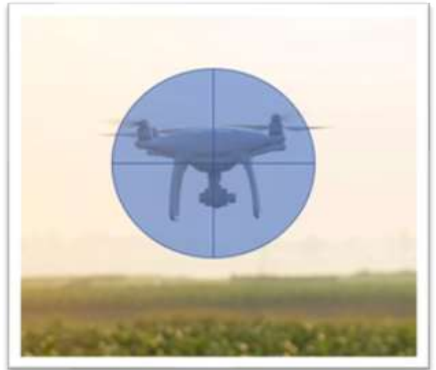
Mini-drones threats to Safety and Security

As part of the evolution of the threats faced by UN peacekeepers, unmanned aircraft systems (UAS), also known as drones, have increasingly been used by armed groups in peacekeeping operation theaters. This capability has quickly become available to nonstate actors and individuals, as UAS are cheap to acquire and easy to operate. At this stage, the UN has only reported the use of such technology for intelligence, surveillance, and reconnaissance against UN troops and facilities. However, there is a possibility that the threat will evolve toward the use of armed UAS employed against the UN, including through the delivery of grenades or improvised explosive devices. In this sense, the UN categorizes three types of threats: direct threat, when the UAS itself is used to attack personnel, vehicles or assets; indirect threat, when the UAS is used to deliver a payload that causes damage; and Intelligence, Surveillance and Reconnaissance (ISR) threats, when the UAS is used to conduct reconnaissance on UN forces which can later be used to plan or coordinate an attack. Any of these can be employed using single UAS or a swarm of UAS, i.e. multiple UAS used to attack simultaneously and overwhelm a defence.