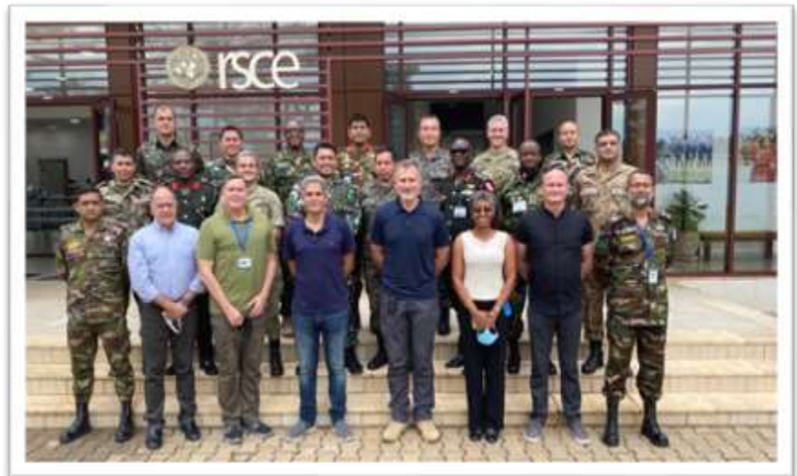
UN Infantry Battalion Commander's Course – Entebbe/Uganda