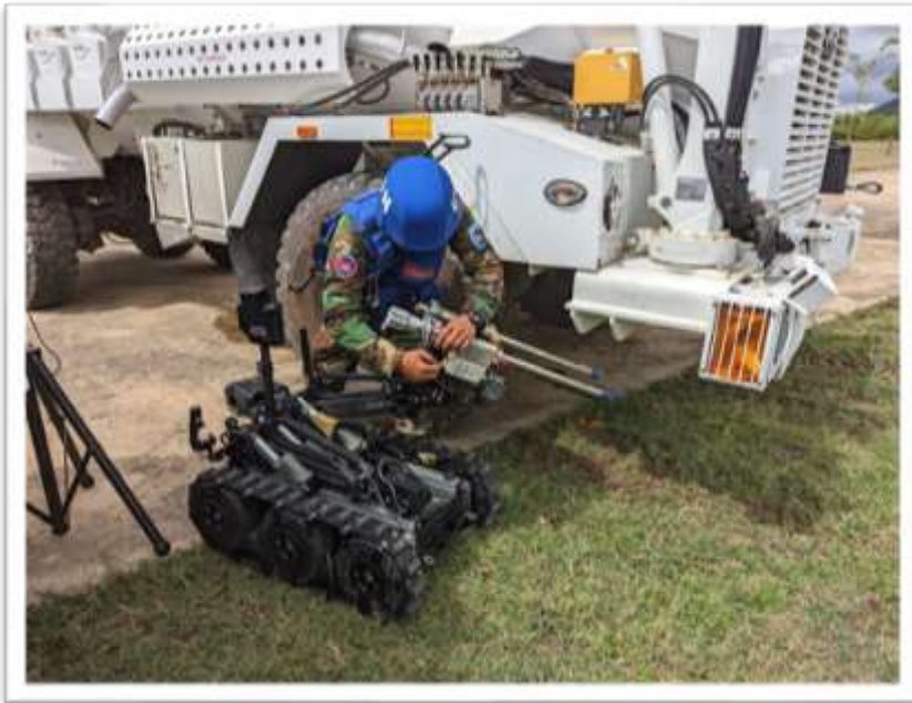
MINUSCA Cambodia EOD Company PDV