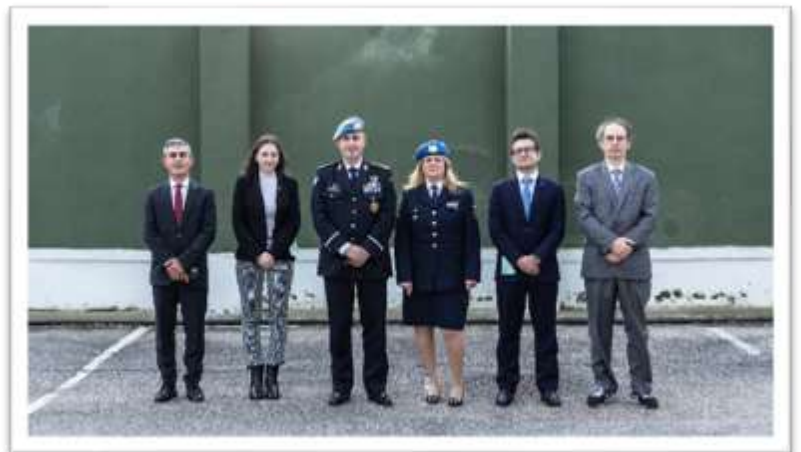
LCM Police Meeting organizers in Brindisi 2021

The LCM has recently released the “Deployment Review” mobile app, a mobile application specifically designed to make a knowledge sharing methodology accessible to all military and police personnel, training centres and academies. The app is now available in both English and French. The LCM is seeking partners to translate this new tool into Arabic, Spanish, Russian and Chinese. For more information and to download the Deployment Review app, click here . Two virtual sessions will be organized, on Tuesday 19 April 2022 (English) and Thursday 21 April 2022 (French), for all Police and Military Advisers, capacity building providers, and colleagues in regional and national training centres to present and explain the “Deployment Review” mobile app. Click here to register .