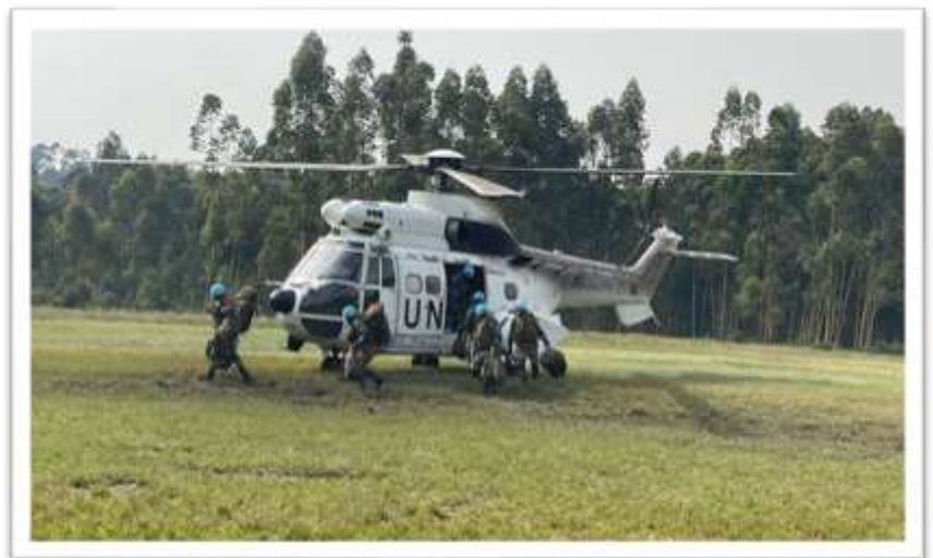
MONUSCO Airlifted Long Range Patrol