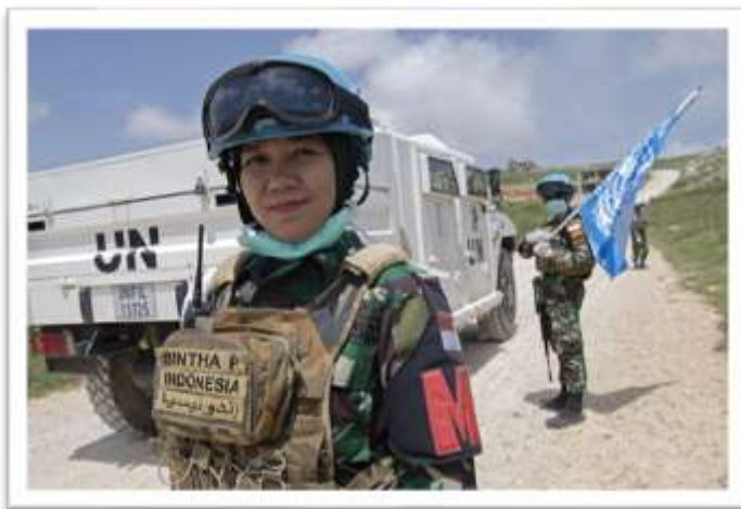
Indonesian woman soldier in UNIFIL

The full, equal and meaningful participation of women at all levels in the UN's military and police components, both as individuals as well as part of formed contingents, remains an operational priority. It is anchored in the Women, Peace and Security Agenda, the shared commitments of Member States through the Action for Peacekeeping Plus (A4P+) Initiative and is part of the Uniformed Gender Parity Strategy (UGPS). At present, there is still a significant imbalance in gender parity in the military component. Diverse teams enhance capability and effectiveness of operations. As such, this imbalance is considered a capability gap.