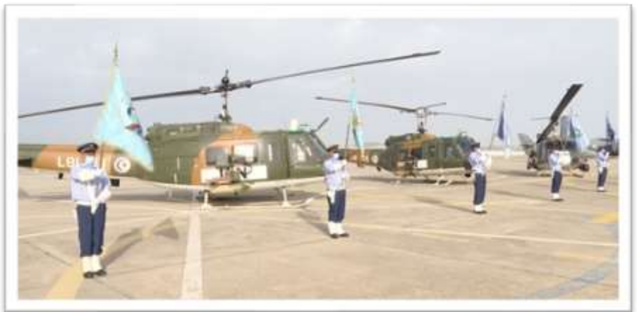
MINUSCA Tunisian Armed Helicopter Unit

Member States have not registered many of these assets in the PCRS. While each unit's technical requirements are specific to its respective SUR, as a general rule, due to the particular operating conditions and hostile environment in which we deploy, UN aviation units are required to be equipped and be capable to operate with: i) night flying capability, including night vision sensors; ii) aviation transponder with mode S (TCAS II) and; iii) Ground proximity avoidance systems (GPWS) and/or terrain avoidance and warning system (TAWS). Regarding our Airborne ISR units, the UN normally requires a capable HD day/night Electro-Optical/Infra-Red camera and optional additional sensors such as Synthetic Aperture radar with ground moving target indicator (SAR/GMTI) and Signal Intelligence sensors (SIGINT).