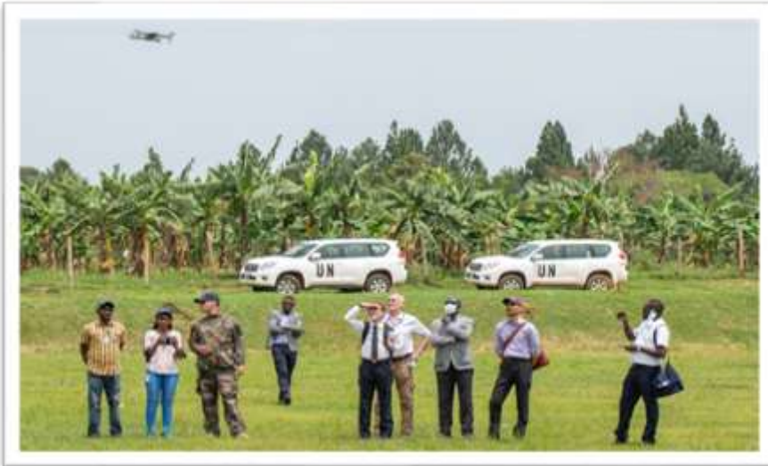
UNCAP's Micro-UAS Remote Pilot Course in Entebbe/Uganda

The Department of Operational Support's Triangular Partnership Programme (TPP) continues to strengthen the engineering, medical and technological capacities of uniformed peacekeepers in 2022 through the development of new technology and remote learning initiatives, as well as continuous implementation of several in-situ courses. The TPP Telemedicine Project launched in cooperation with DHMOSH and OICT, and continues to be piloted in