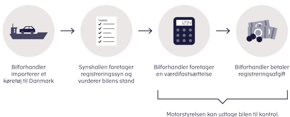
Figur 2. Overblik over processen ved import af biler

Herudover er det en del af aftalen, at Motorstyrelsen skal implementere en ny kontrol- og vejledningsstrategi på importområdet. Indsatsen målrettes virksomheder, hvor der vurderes at være størst risiko for udfordringer med værdifastsættelsen.