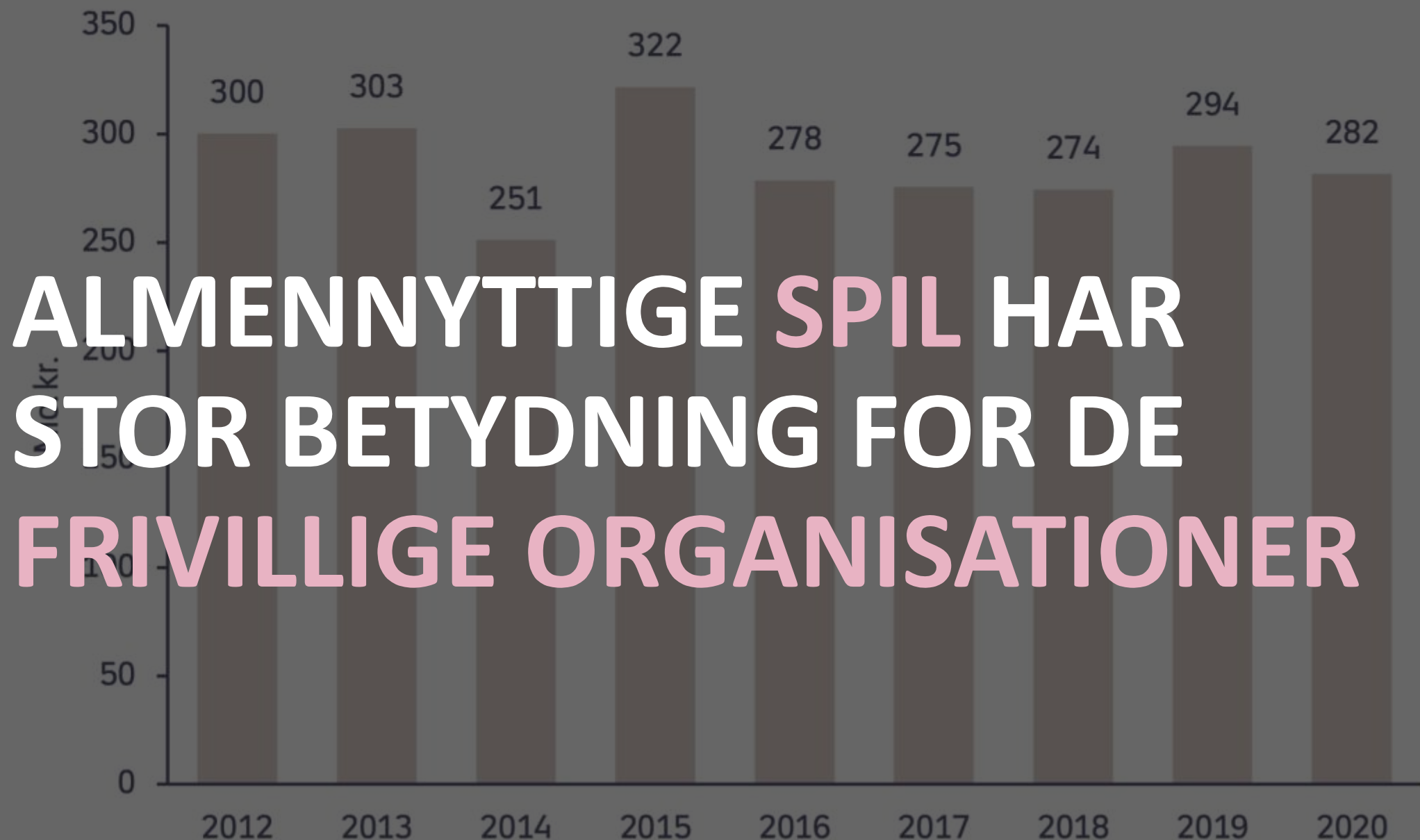
Figur 21. BSI fra almennyttige lotterier, 2012-2020, mio. kr.

ALMENNYTTIGE SPIL HAR STOR BETYDNING FOR DE FRIVILLIGE ORGANISATIONER