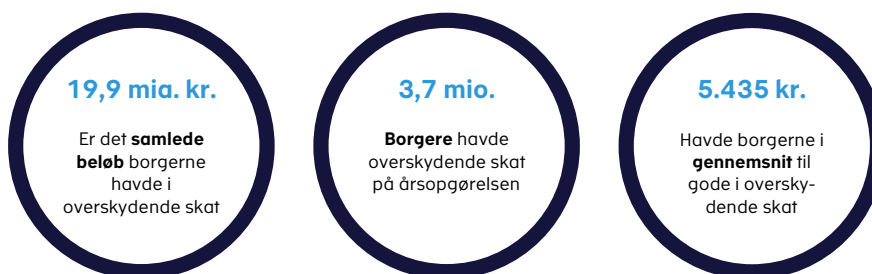
Figur 1. Nøgletal for udbetalingen af overskydende skat for indkomståret 2021.

Skattestyrelsens opgørelser for indkomståret 2021 viser, at 3,7 mio. borgere har 19,9 mia. kr. i overskydende skat. Det svarer til 5.435 kr. i gennemsnit per borger, jf. figur 1.