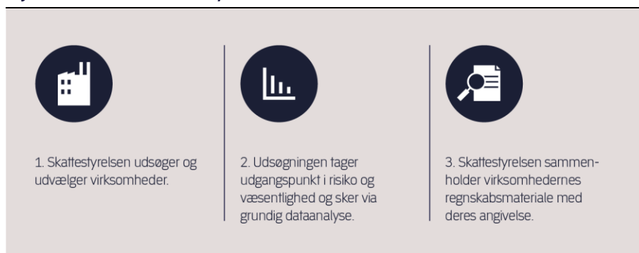
Figur 2. Sådan udfører Skattestyrelsen kontrollerne

Af figur 2 fremgår forløbet, som beskrevet ovenfor.