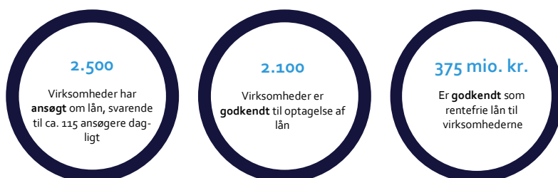
Figur 1. Status på låneordningen, 17. nov. – 8. dec. 2020

I perioden fra den 17. november 2020 til den 8. december 2020 har Skattestyrelsen modtaget og behandlet godt 2.500 ansøgninger. I alt har knap 2.100 virksomheder fået godkendt lån for ca. 375 mio. kr., jf. figur 1.