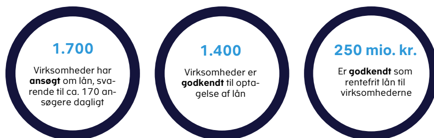
Figur 2. Status 10 dage efter genåbning af låneordning

Blandt de knap 1.700 virksomheder, der har ansøgt om et lån i løbet af de ti første dage, har knap 1.400 virksomheder fået godkendt deres ansøgning om lån. Samlet er der godkendt lån for ca. 250 mio. kr., jf. figur 2.