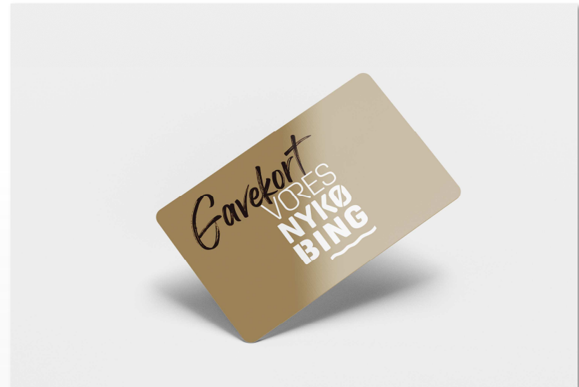
Gavekort til 120 lokale butikker & oplevelser

Medarbejdere beskattes. Gavekortet kan ombytte til kontanter jf. EU-lovgivning.