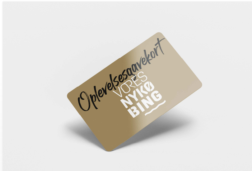
Gavekort til oplevelser

Kan gives skattefrit til medarbejdere. Kan ikke ombyttes til kontanter.