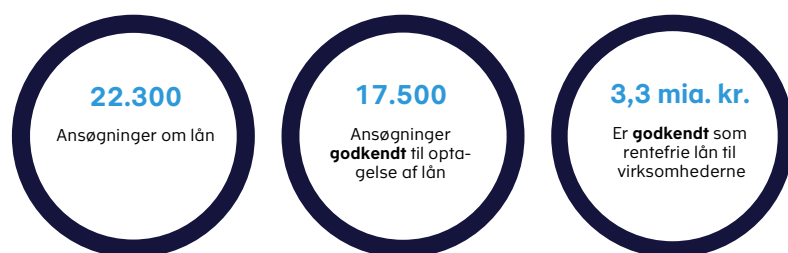
Figur 1. Nøgletal for A-skattelåneordninger

I alt har Skattestyrelsen modtaget ca. 22.300 ansøgninger om et rentefrit lån via de to A-skattelåneordninger, der har været åbne i perioden fra den 3. februar til den 8. april 2021. Samlet er ca. 17.500 ansøgninger blevet godkendt til rentefrie skattelån for ca. 3,3 mia. kr., jf. figur 1 . Det svarer til, at 79 pct. af de behandlede ansøgninger er imødekommet af Skattestyrelsen.