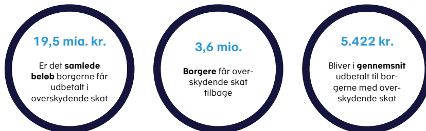
Figur 1. Nøgletal for udbetalingen af overskydende skat for indkomståret 2020.

Skattestyrelsens opgørelser for indkomståret 2020 viser, at 3,6 mio. borgere har 19,5 mia. kr. i overskydende skat. I alt svarer det til, at hver borger med overskydende skat, har 5.422 kr. til gode i gennemsnit, jf. figur 1 . Samtidig skal godt 900.000 borgere betale restskat på i alt 7,1 mia. kr. for indkomståret 2020.