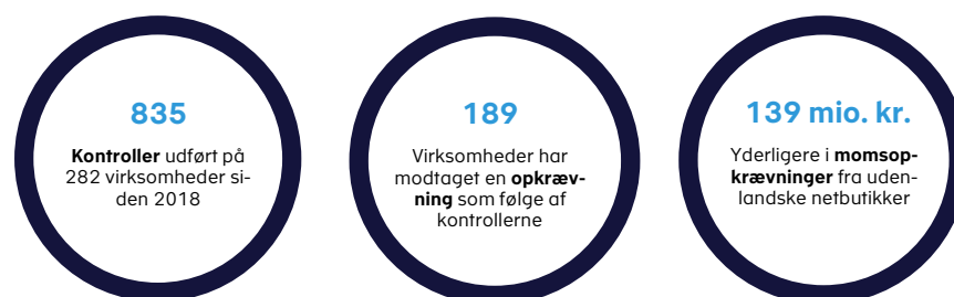
Figur 1. Nøgletal fra kontrolindsatsen af udenlandske netbutikker, 2018-2020

Anm.: I opgørelsen indgår resultaterne af et mindre antal kontroller af punktafgifter, som er gennemført i tilknytning til momskontrollen af punktafgiftspligtige virksomheder. Kilde: Skattestyrelsen.