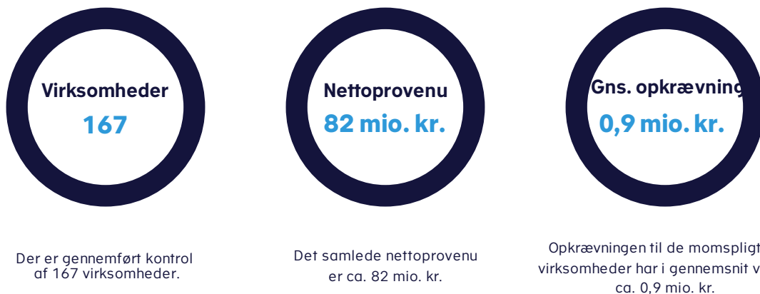
Figur 1. Foreløbige resultater fra kontrol af udenlandske internetvirksomheder, der sælger varer til danske forbrugere

Internetvirksomheder fra et andet EU-land, der sælger varer til danske forbrugere for mere end 280.000 kr. om året, skal momsregistreres og betale dansk moms.