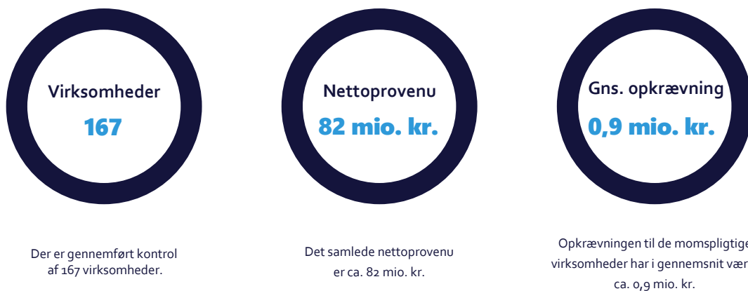
Figur 1. Foreløbige resultater fra kontrol af udenlandske internetvirksomheder, der sælger varer til danske forbrugere

Internetvirksomheder fra et andet EU-land, der sælger varer til danske forbrugere for mere end 280.000 kr. om året, skal momsregistreres og betale dansk moms.