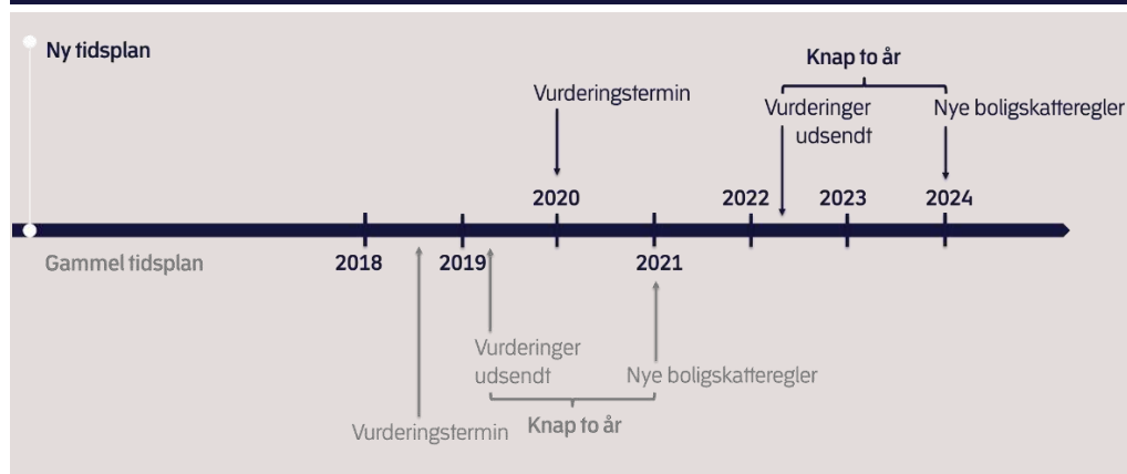
Figur 1. Sammenhæng ml. vurderinger og nye boligskatteregler med gammel og ny tidsplan

der udarbejdes en alternativ tidsplan for implementeringen, der kan imødekomme de identificerede risici.