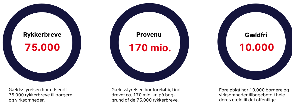
Figur 2. Nøgletal for sommerens rykkerindsats

Gældsstyrelsen har i begyndelsen af november intensiveret indsatsen, og påbegyndt udsendelsen af over 400.000 rykkerbreve til borgere og virksomheder vedrørende gæld for ca. 58 mia. kr.