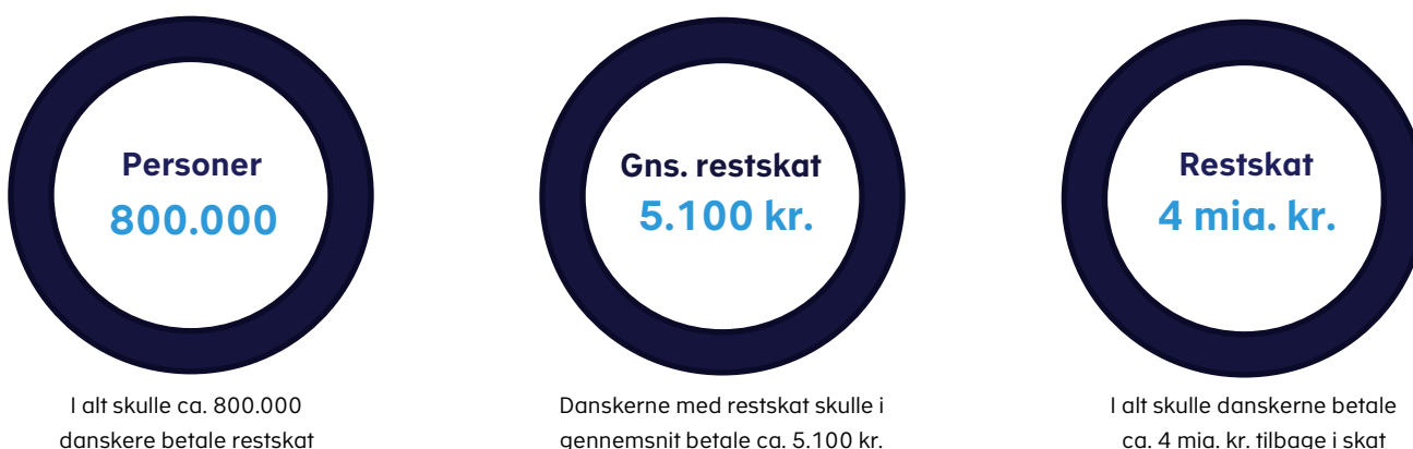
Figur 2. Fakta om danskernes restskat i 2018

I marts 2019 fik i alt 800.000 borgere i Danmark således besked om, at de havde betalt for lidt skat i indkomståret 2018 og derfor skulle betale restskat. Samlet skulle danskerne betale ca. 4 mia. kr. i restskat. Danskerne, med restskat på årsopgørelsen, skulle i gennemsnit betale ca. 5.100 kr., jf. figur 2 .