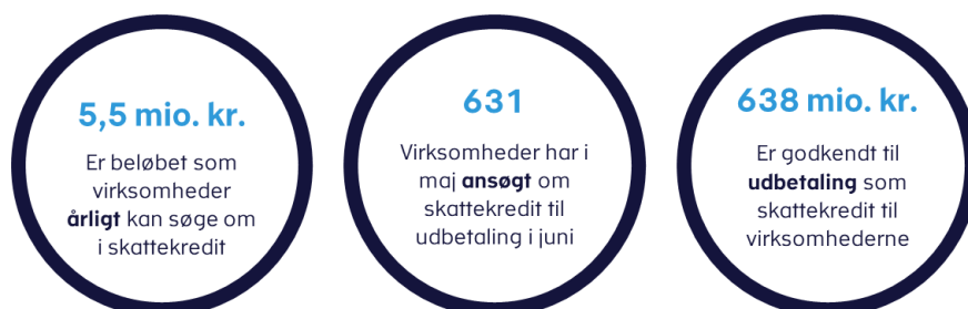
Figur 2. Status pr. 1/8 efter fremrykket udbetaling af skatte kreditter

Når virksomhedernes oplysningskemaer indsendes senere på året, vil Skattestyrelsen ydermere kontrollere og sammenholde de oplyste udgifter til forsknings- og udviklingstiltag med de oplysninger, som er fremgået af ansøgningerne, der blev indsendt i maj.