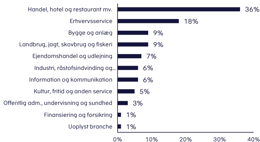
Figur 2. Ansøgende virksomheder fordelt på brancher i procent

Det er især virksomheder inden for brancherne handel, hotel og restaurant mv. samt erhvervsservice med henholdsvis 36 pct. og 18 pct., der tegner sig for hovedparten af ansøgningerne, jf. figur 2. Virksomheder inden for brancherne handel, hotel og restaurant mv. har samlet fået godkendt lån for ca. 2,3 mia. kr.