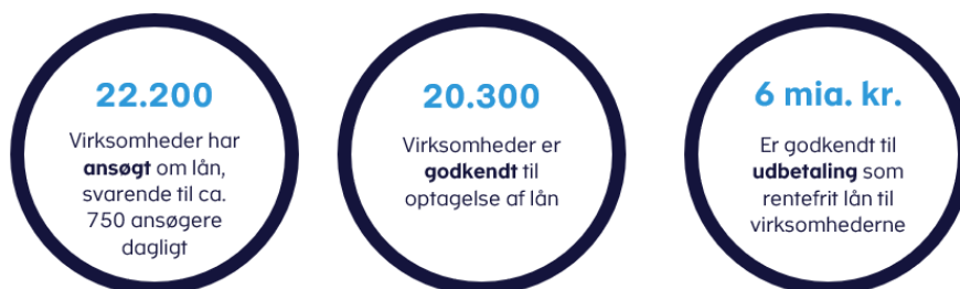
Figur 3. Status en uge inden ansøgningsfristen den 15. juni 2020

Fra Skattestyrelsen modtager en ansøgning, går der op til fem hverdage, før lånet udbetales til virksomheden. Inden lånet udbetales, foretages en kontrol af, om den pågældende virksomhed skylder penge til Skattestyrelsen eller har øvrig gæld til det offentlige. Denne gæld vil blive dækket, før lånet udbetales til virksomheden. Skattestyrelsen har indtil videre nedbragt virksomhedernes gæld under inddrivelse med 800 mio. kr. Herudover er en andel af lånene anvendt til at dække virksomhedernes øvrige krav på Skattekontoen, hvis de ikke er betalt.