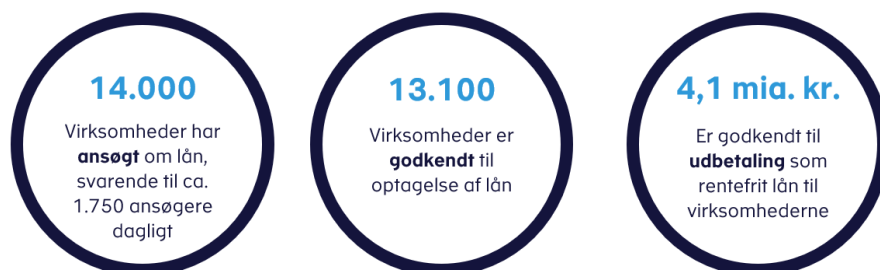
Figur 3. Status efter den første uge af låneordningen

Ansøgningsfristen for moms- og lønsumsafgiftslån udløber den 15. juni 2020.