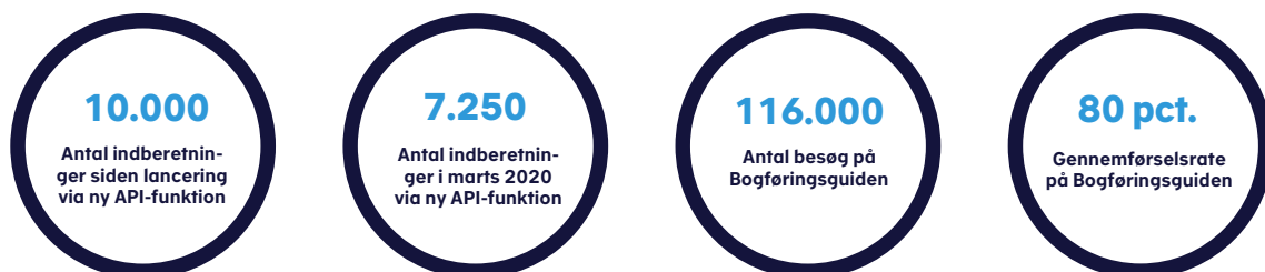
Figur 1. Resultater for anvendelse af Skattestyrelsens nye digitale tiltag

Siden lanceringen har Skattestyrelsen modtaget mere end 10.000 momsangivelser via API-løsningen fra de mere end 9.000 erhvervsdrivende, som indtil nu har benyttet løsningen. Da årets første momsfrist udløb den 2. marts 2020 havde styrelsen modtaget ca. 7.250 momsindberetninger via den nye it-løsning, jf. figur 1.