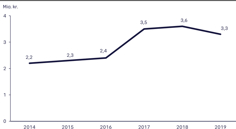
Figur 1. Udvikling i provenu fra modregning, 2014-2019

I 2019 inddrev Gældsstyrelsen ca. 3,3 mia. kr. ved at modregne gæld i udbetalinger fra det offentlige. Til sammenligning inddrev Gældsstyrelsen ca. 2,2 mia. kr. i 2014 gennem modregning, jf. figur 1 .