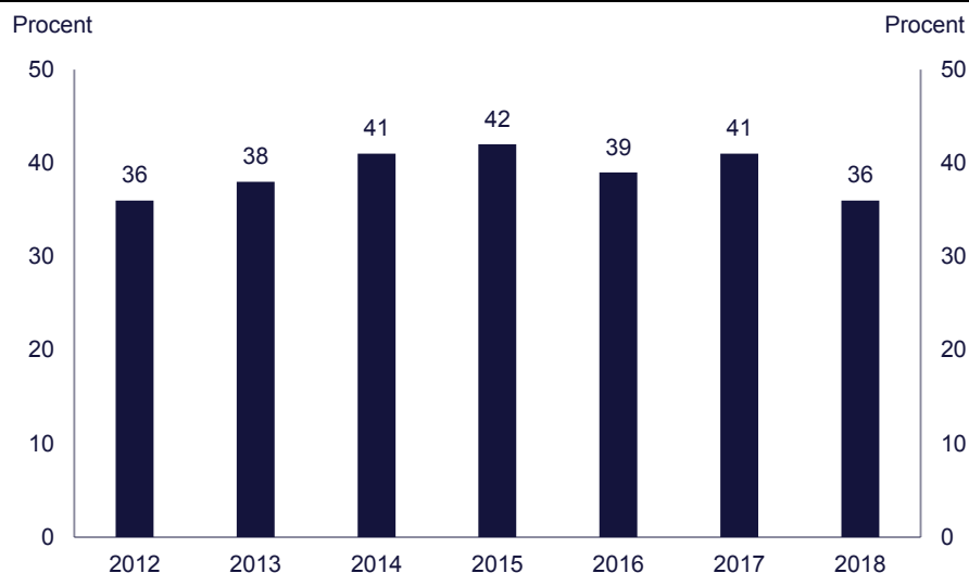
Figur 2. Andel af skattepligtige selskaber, der betalte selskabsskat, 2012-2018

Specifikt for 2018 kan faldet desuden forklare ved, at der i det pågældende år var en kraftig stigning i antallet af nye såkaldte iværksætterselskaber (IVS).